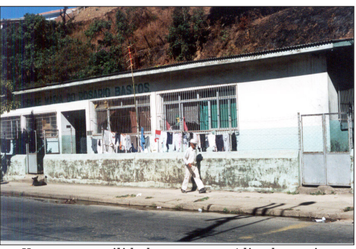
Uma nova utilidade para o prédio da antiga creche e CEMAE Maria do Rosário Bastos