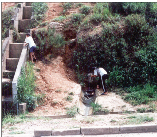
Perigo: DMAE adverte que mina está contaminada