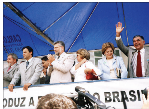
Palanque de autoridades durante a inauguração da usina hidrelétrica Padre Carlos