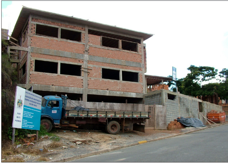
A nova creche do Jardim São Paulo já está quase pronta