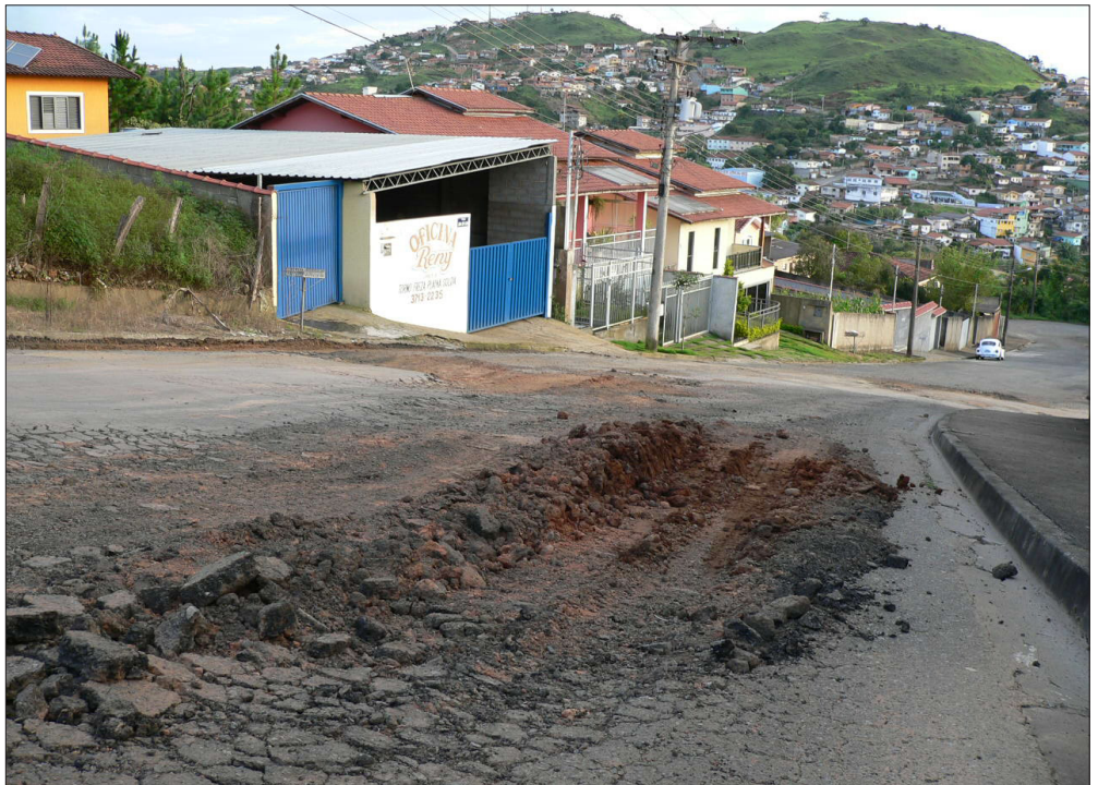
As ruas dos bairros da Zona Leste foram severamente castigadas pelas últimas chuvas

Além dos buracos, também houve desbarrancamento em alguns bairros - principalmente no Santo André, onde uma casa desabou na Rua da Consolação. Não houve feridos, mas uma família ficou desabrigada.