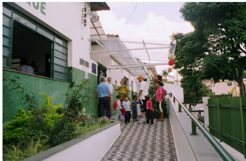
Inauguração de melhorias no CEI do Charque