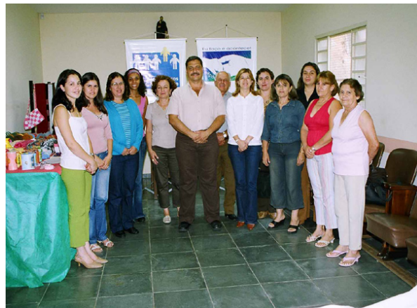
Representantes do Lar dos Velinhos e da Alcoa-Poços na inauguração do muro do Lar dos Velinhos, que garantirá mais segurança para os idosos