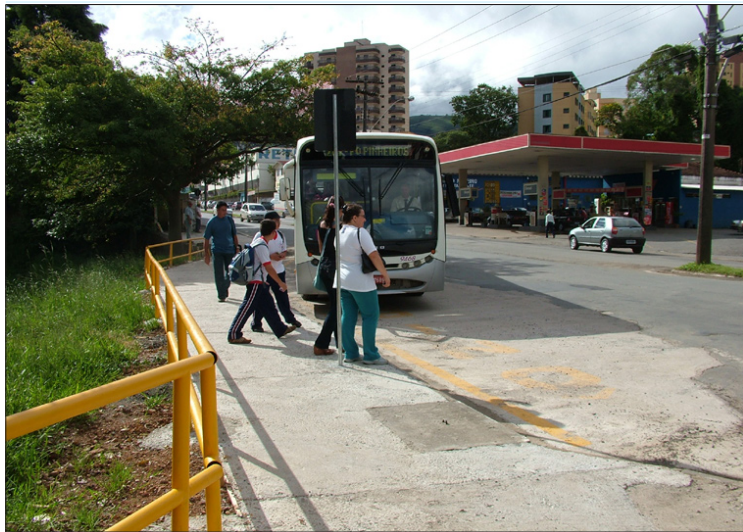
Novo ponto de ônibus perto da 25ª Delegacia de Polícia