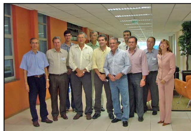
A comitiva local e da UNIFAL foi recebida na sede da Alcoa