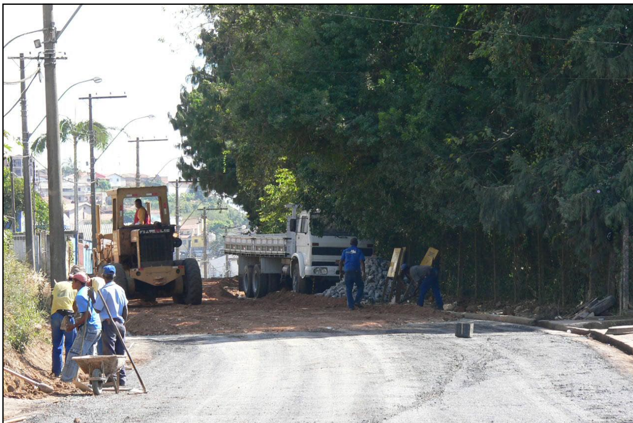
Homens e máquinas trabalham duro para concluir a recuperação da Cel. Virgílio Silva o mais rápido possível