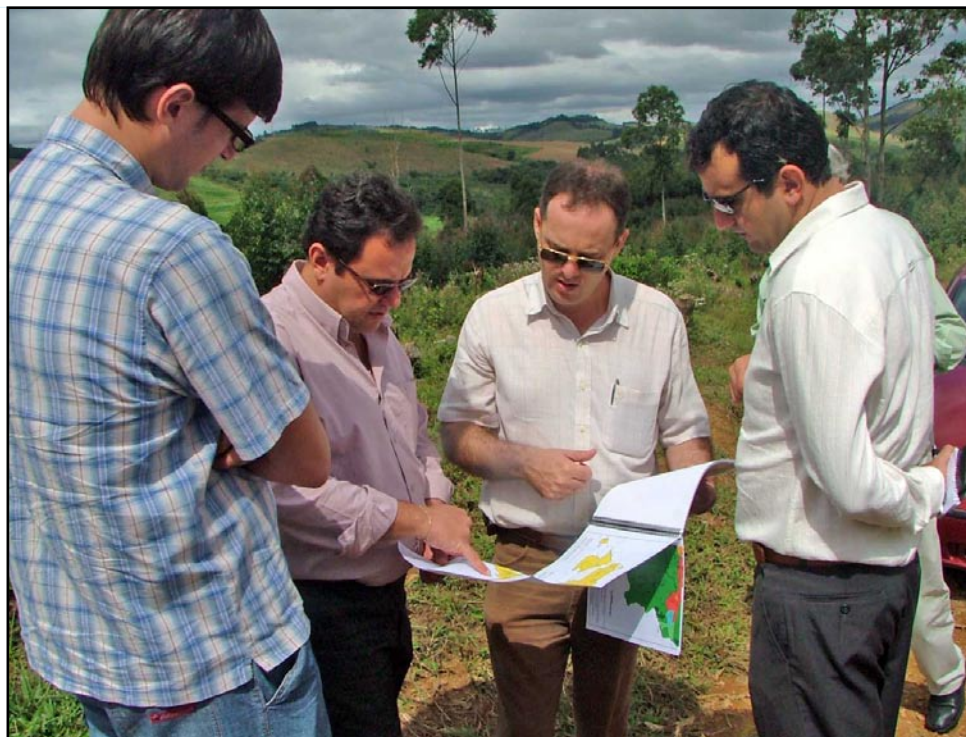
O terreno doado para construção do Campus fica perto do Hotel Fazenda Poços de Caldas

esta seria uma chance única para que os jovens tivessem oportunidade de estudar e conseguir um futuro melhor. "Tenho certeza que nosso dever é apoiar todas as iniciativas que tenham como objetivo concretizar as aspirações do nosso povo, principalmente dos jovens que buscam sempre um amanhã melhor. E isso só acontecerá se proporcionarmos a ele a chance de estudar. Ao conversar com o deputado Geraldo Thadeu pude ver sua disposição e vontade em concretizar este sonho dos munícipes. Por isso é que senti a necessidade de falar com os vereadores sobre a importância da união quando se quer melhorar as condições de vida das pessoas. Espero que o câmpus avançado, com o apoio de todos, seja uma realidade em breve", ressaltou.