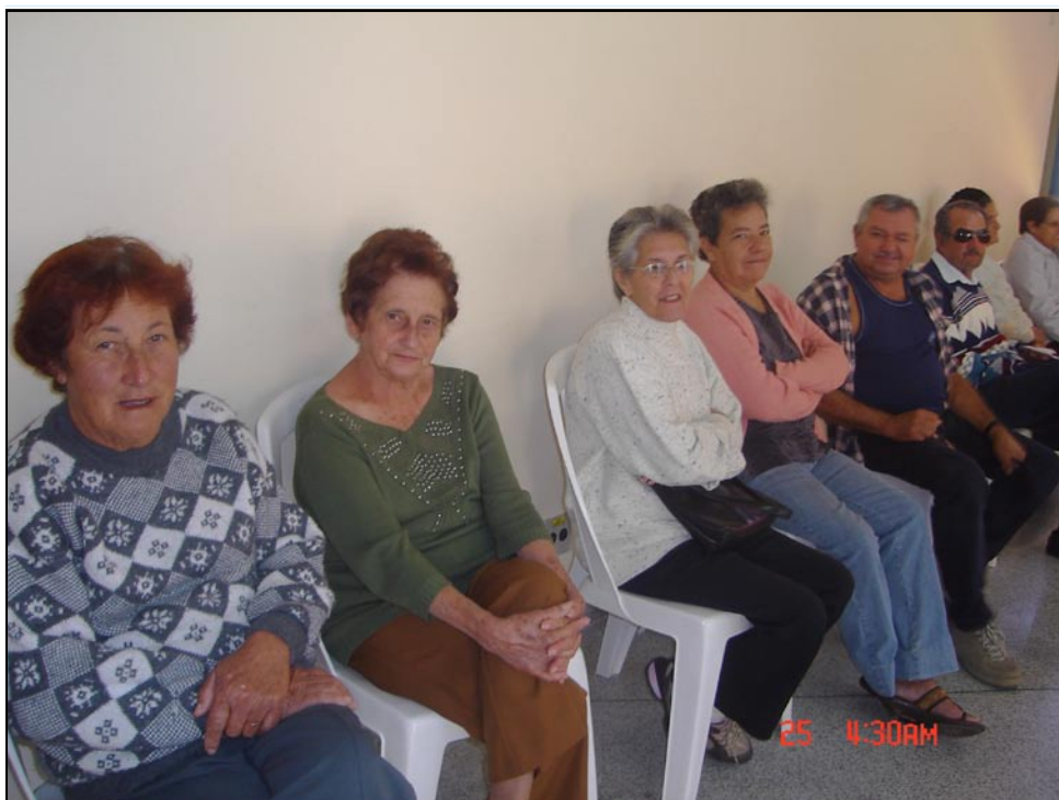
A Feliz Idade: participantes aprovaram atividades do SEST/SENAT