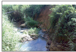
Deslizamentos são comuns no Ribeirão da Serra