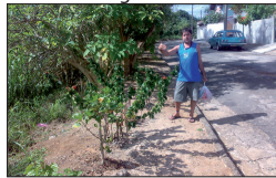
Morador refloresta margens