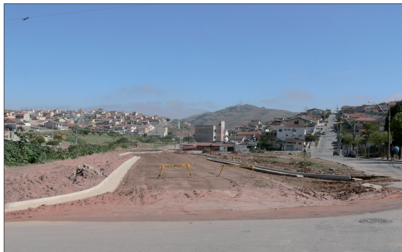
Trânsito organizado: com a rotatória, o trânsito vai fluir mais facilmente entres os bairros