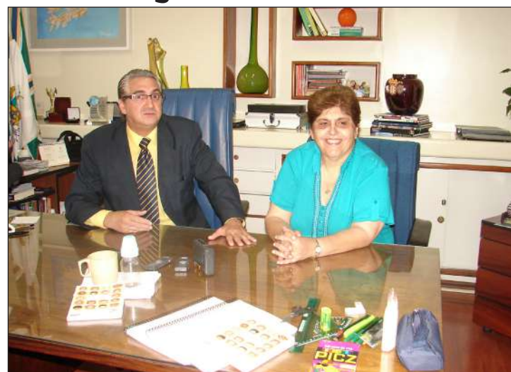
Prefeito e secretária de Educação reafirmam o compromisso da Prefeitura em fornecer material escolar básico para todos os alunos da rede municipal

Foram investidos aproximadamente R$ 650 mil na aquisição dos kits. "A entrega do material escolar é um direito dos alunos das escolas públicas e esse é um compromisso do nosso prefeito, que ouve as reivindicações da população", ressalta a secretá-