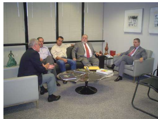
Os deputados e o vice-governador Anastasia

fiscais, o Prefeito Municipal apresenta à Câmara, através de sua Comissão de Finanças e Orçamento e à comunidade como um todo, os resultados obtidos a cada quadrimestre, quanto ao cumprimento das metas estabelecidas na Lei de Diretrizes Orçamentárias que, evidentemente, observou as metas traçadas no Plano Plurianual. O Prefeito Municipal tem ainda a oportunidade de demonstrar as ações de seu governo, comprovando ou confrontando os números apresentados em relatórios, com fotografias ou filmagens.