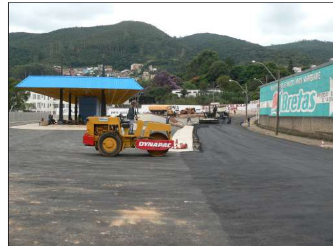
Terminal da Zona Leste: pronto para funcionar

A próxima etapa é a implantação do novo sistema integrado. Serão criadas linhas ligando os bairros ao terminal