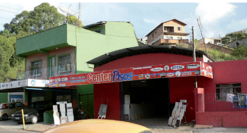
Center Pisos: agora também na Rua Coronel Virgílio Silva, no bairro Dom Bosco