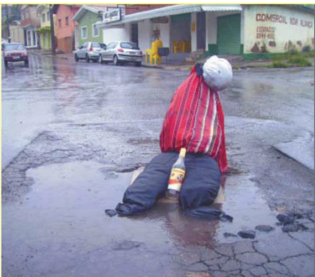
Moradores do Dom Bosco querem melhorias no calçamento de diversas ruas do bairro

Melhorias no trânsito – O prefeito disse também que várias iniciativas simples vão dar mais segurança e agilidade ao trânsito da Zona Leste – principalmente nas avenidas José Remígio Prêzia e Wenceslau Braz. Serão fechados os acessos ao DER e aos bairros Santa Rosália pela Rua Sebastião Tomás de Oliveira, o que deverá ser feito pelo trevo do Parque Primavera, que será transformado em rotatória para agilizar o tráfego de veículos. No entroncamento da Wenceslau Braz com a Rua Lusitânia, será aberta uma passagem entre os bairros Dom Bosco e Parque Primavera. Será construída outra rotatória no entroncamento da Wenceslau Braz com a estrada do Frigorífico Tamoyo. Segundo o prefeito, estas obras, apesar de simples, vão dar mais segurança ao tráfego cada vez mais pesado nesta que é a principal entrada da cidade, ligando Poços de Caldas aos municí-