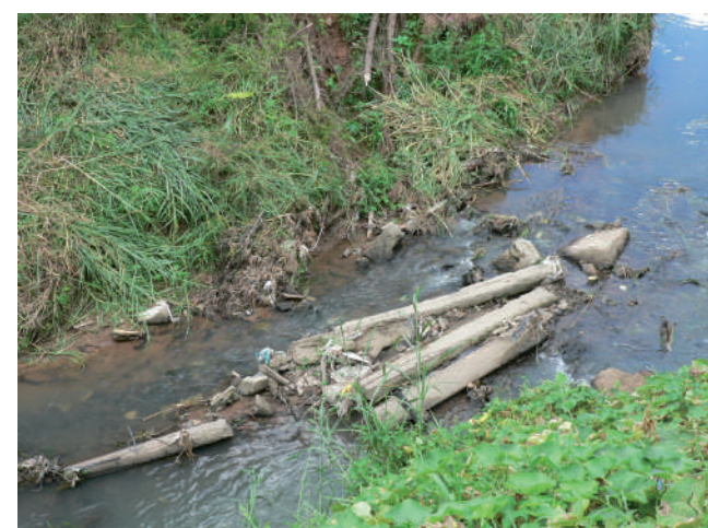
Pedraço de muro de arrimo destruído pelas chuvas

Desiludidos, os moradores pensam em eles mesmo executar as obras.