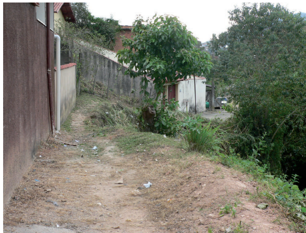
A cada chuva, um pedaço da Rua Claudina Brandina de Moraes vai por água abaixo

O impostômetro pode ser consultado na internet no endereço eletrônico www.impostometro.com.br .