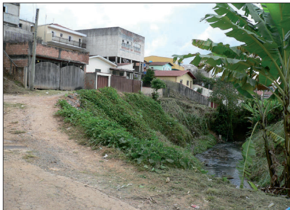
Sem solução: rua perde um pedaço a cada chuva e prejudica moradores

O prefeito Paulinho Courominas disse que 2010 será um ano de muitas obras em diversos bairros da Zona Leste. Uma das primeiras será a construção de um trevo no entroncamento da Rua Lusitânia com a Av. Wenceslau Braz, melhorias no trevo de acesso ao Parque Primavera, asfaltamento da Estrada da Cachoeirinha e duplicação da Av. José Bianucci. Veja mais na página 4 desta edição.