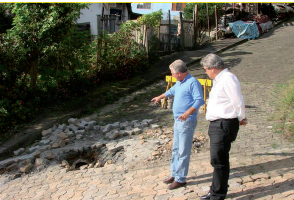
O vereador mostra ao secretário de Obras os estragos na pavimentação da Rua Agreste