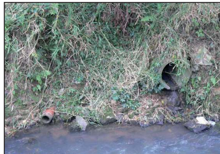
Esgoto clandestino é lançado em diversos pontos do ribeirão