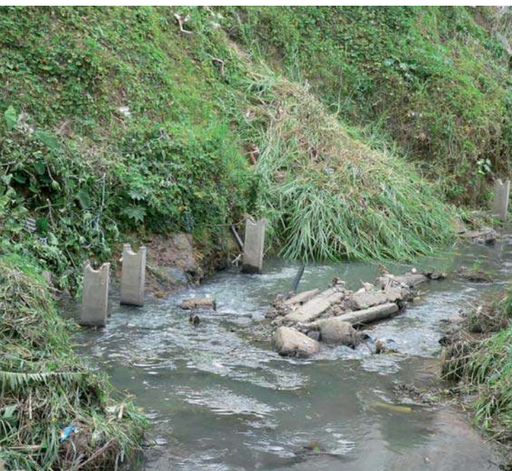
No bairro Augusto de Almeida, a rede que coletava o esgoto clandestino foi destruída e assim continua