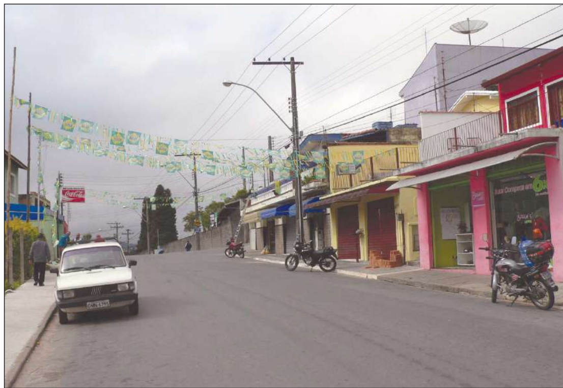
Copa do Mundo 2010: Ruas da Chácara Alvorada já estão enfeitadas com os temas nacionais