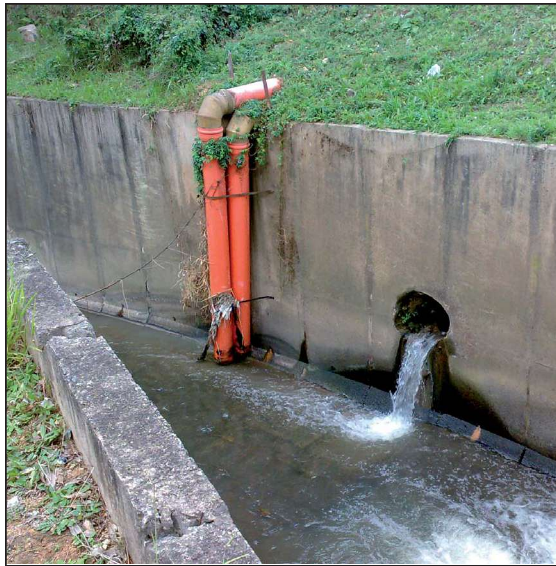
Interceptor lançou diretamente no ribeirão milhares de toneladas de esgoto após deslizamento atrás da 25ª DRPC em 2008