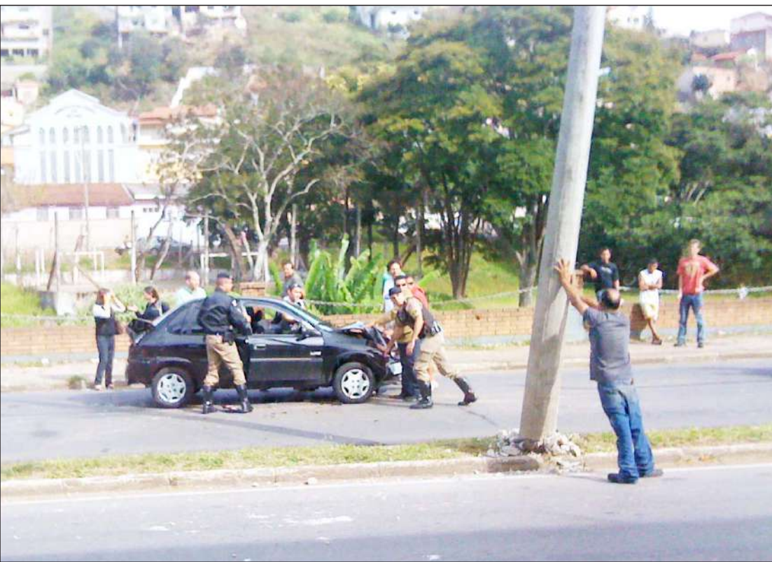
Durante acidente na Remígio Prézia, um bêbado que passava pela área resolveu "escorar" o poste para que ele não caísse. Risos do público e bronca dos policiais