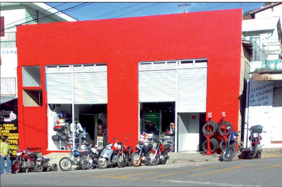
Mudanças no visual: a Scott Motos agora recebe as cores da Will Motos