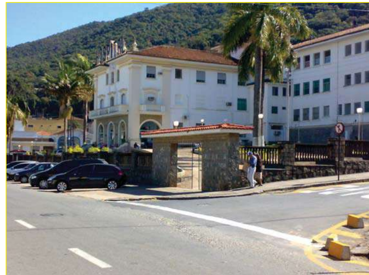
Depois do ex-ministro José Serra, a saúde da Santa Casa nunca mais foi a mesma