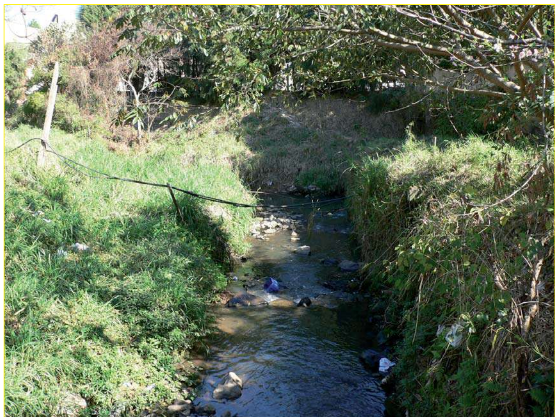
Ribeirão da Serra: matagal, lixo e poluição continuam preocupando moradores da região