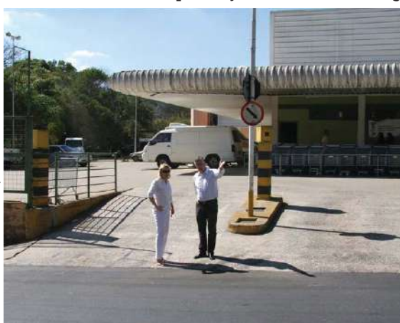
A vereadora e Lúcio caminha em frente ao Bretas naquele local.

A vereadora esteve também, nesta semana, no trevo que dá acesso ao bairro Parque das Nações. A reclamação dos moradores é a mesma, ou seja, melhorias na sinalização. O diretor do Demutran afirmou que será feito um estudo do fluxo de pedestres para analisar a viabilidade de implantação de traffic calming