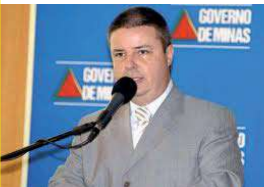
Governador Anastasia: 18%

Rápido-Luxo Campinas Sua melhor companhia de viagem... Fretamento - Turismo - Romarias Rua Campestre, 89 - Bairro: Santana - Fone: (35) 3722-1504