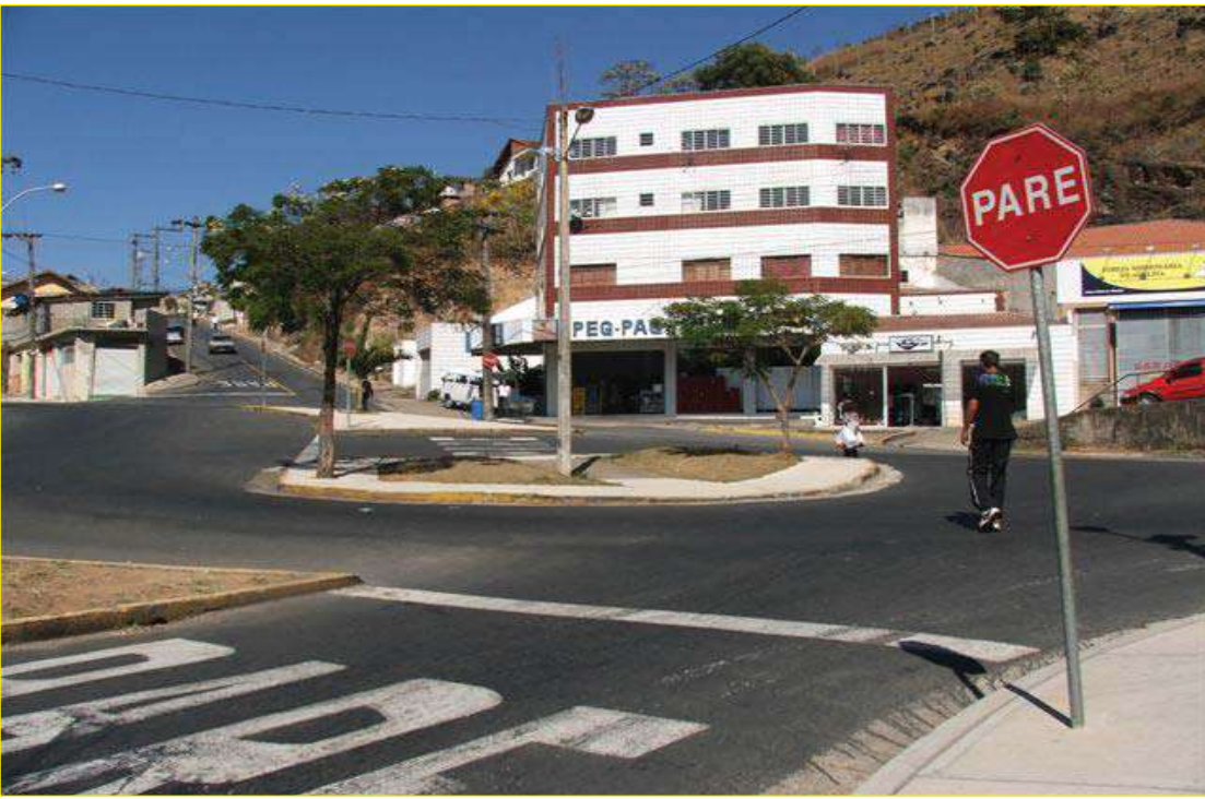
A situação é caótica nos diversos pontos de travessia no trevo