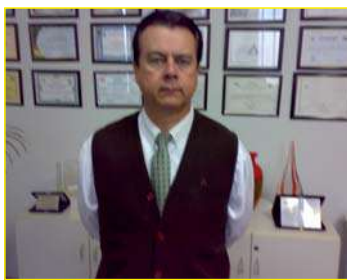
Dr. Carlos Camargo

O Dr. Carlos Camargo destacou que graças ao empenho da equipe, a criminalidade está sob controle na cidade. "Efetuamos diuturnamente ações de inteligência e atuação preventiva. Prin-