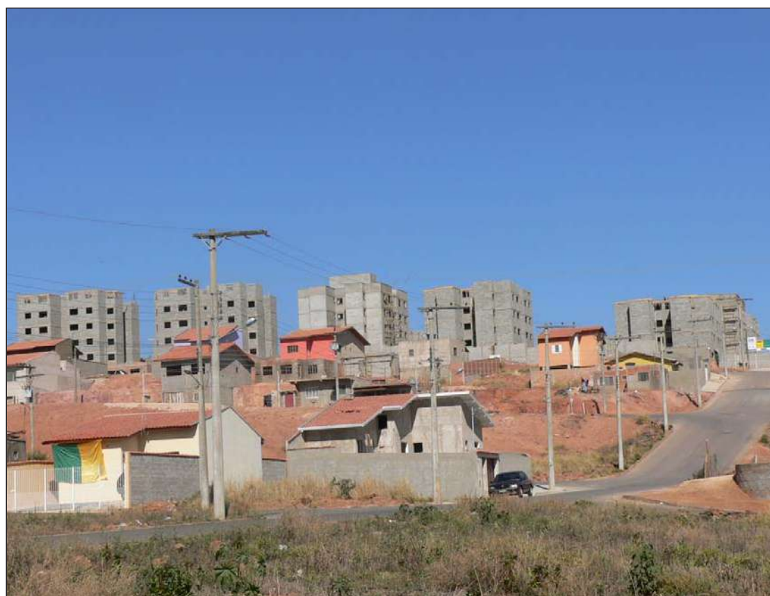
Obras em ritmo acelerado: em breve, novos moradores no Jd. Itamaraty

Mesmo com todas essas moradias o prefeito reconhece que ainda existe um déficit signi-