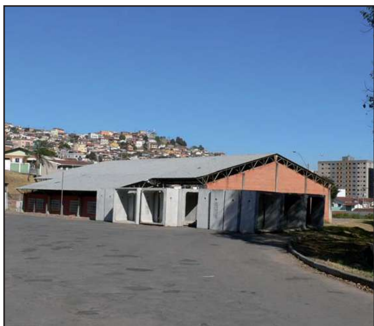
Ginásio poliesportivo vai ser transferido para o CSU