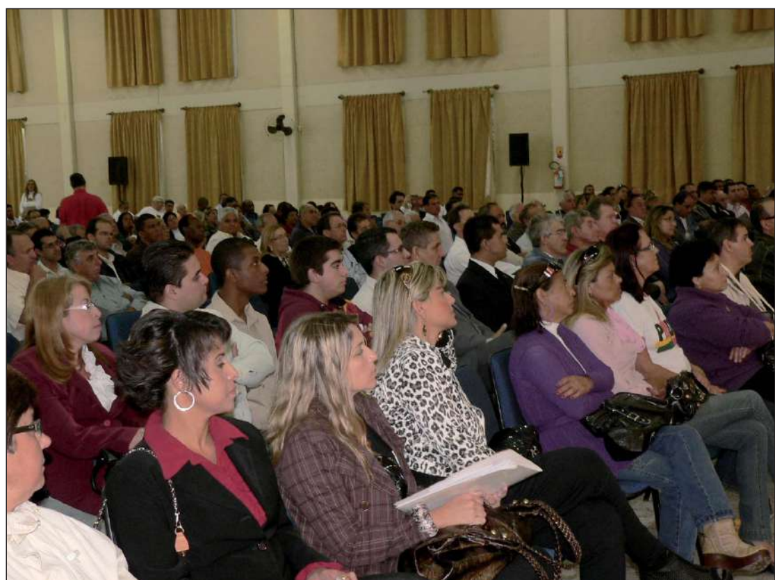
Centenas de lideranças políticas da região lotaram o Cenacon para receber Hélio Costa