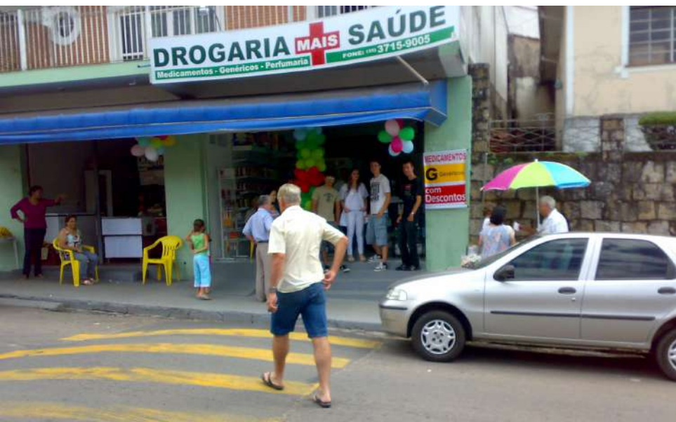
A Drogaria Mais Saúde teve uma inauguração bastante movimentada