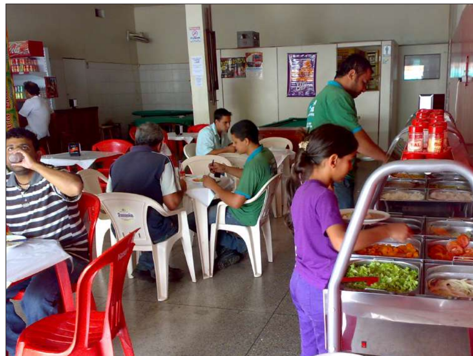
Bar du Urutu agora tem sistema self service: é o progresso chegando à região