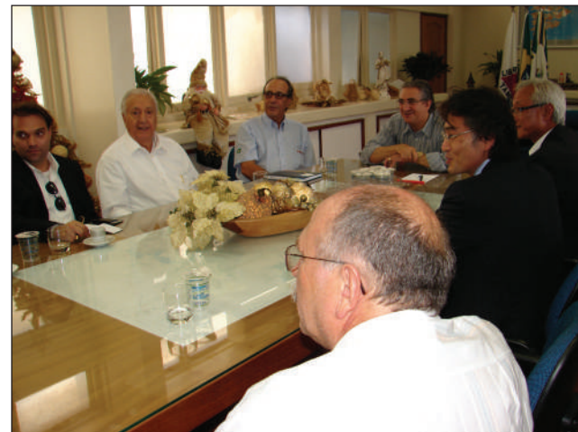
Diretores da Curimbaba e Yoorin fecham acordo

Com a aquisição, a Mineração Curimbaba concretiza sua aspiração de se estabelecer como um fabricante nacional de fertilizantes, suportada por seu potencial de prospecção de minerais usados na produção dessa categoria de produtos. Além disso, a empresa mineradora pretende au-