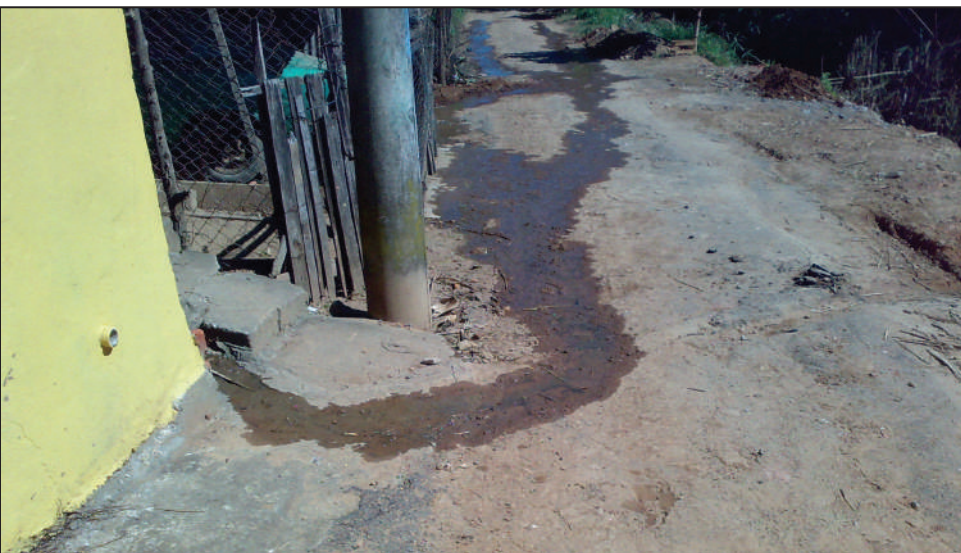
Qualidade de vida? Além de não ter asfalto, a rua agota tem esgoto a céu aberto