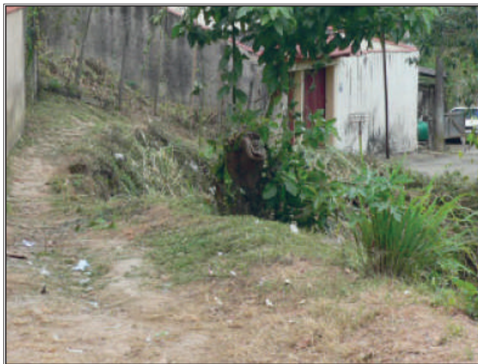
Caminho interrompido: cratera avança cada vez mais e vai "comendo" a rua