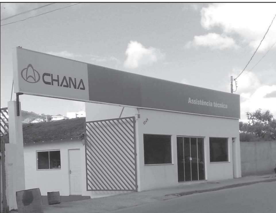
Centro de assistência técnica da Chana na Vila Nova: tranquilidade e garantia pós-venda