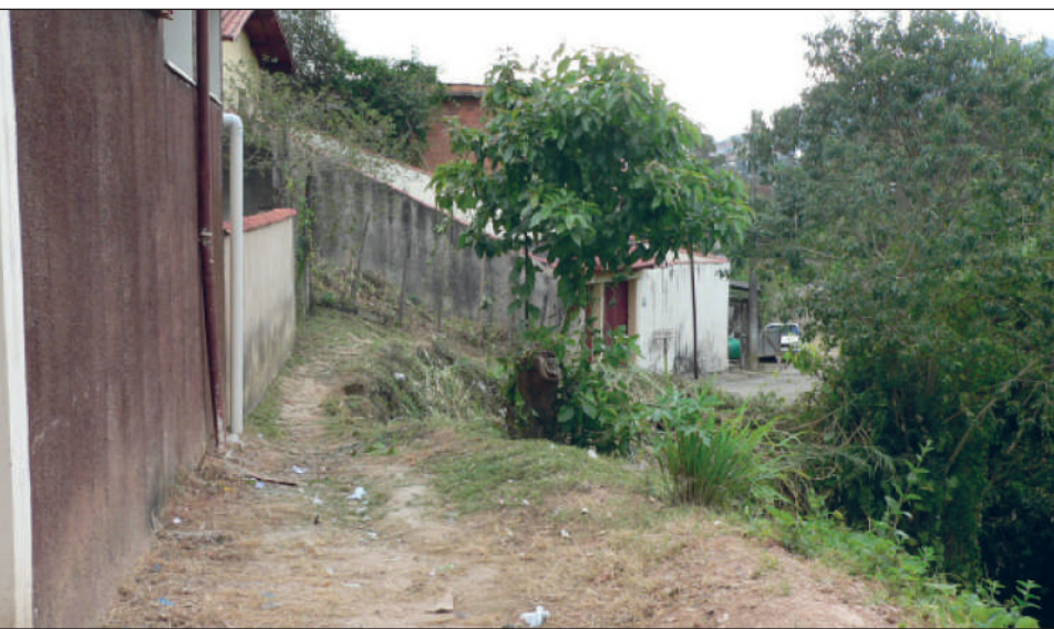
Um drama que perdura há anos: Rua Claudina Brandina de Moraes