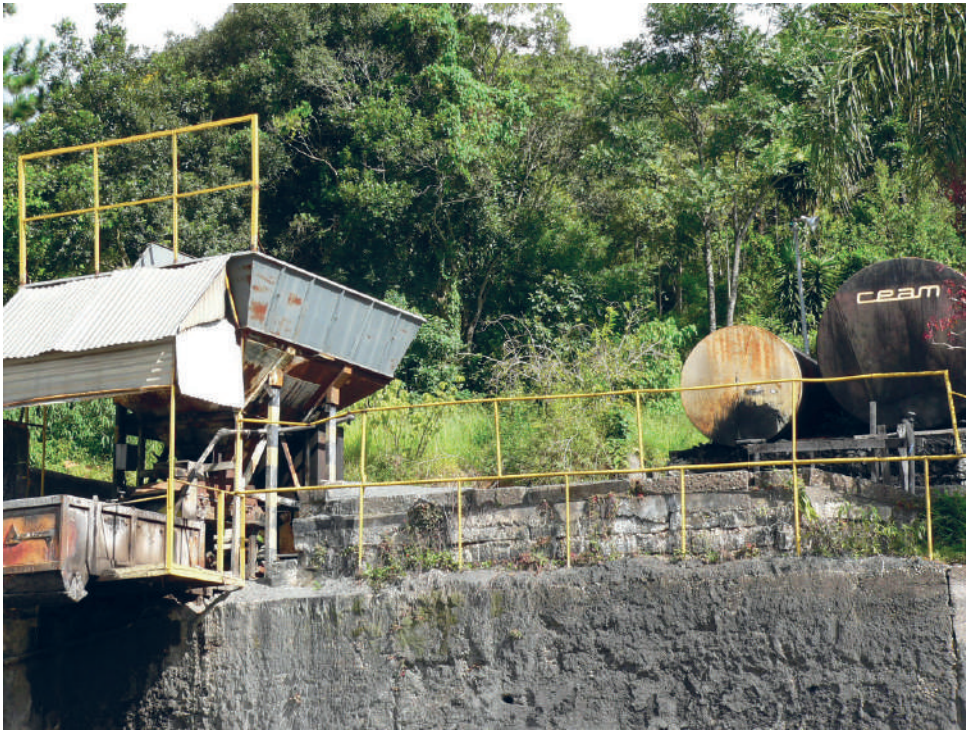
Usina de asfalto da Prefeitura no Parque Primavera: Moradores reclamam

maça, que se espalha pelo bairro que fica muito próximo à usina. Muitos moradores contam que esta fuligem tem um cheiro muito forte, o que causa mal estar e até mesmo complicações respiratórias para pessoas mais sensíveis. O pessoal da Prefeitura disse estar ciente do problema, mas dizem que não há filtros mais eficientes para resolver o problema. Os moradores exigem uma solução imediata e o fim da fumaça.