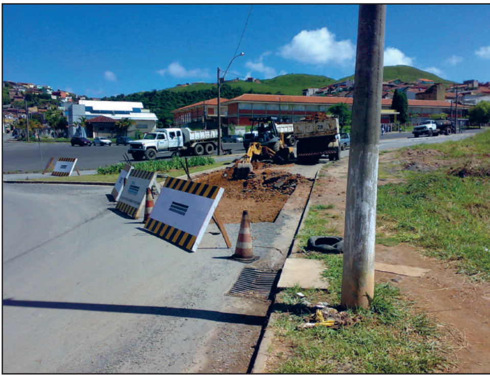
Trevo do Amarylis / Jd. Ipê: mais uma tentativa de acabar com os buracos na pista

O vereador quer que a Prefeitura acompanhe mais de perto a execução destas obras e só efetue o pagamento quando se tiver certeza que os trabalhos foram feitos dentro dos melhores padrões de qualidade e se-