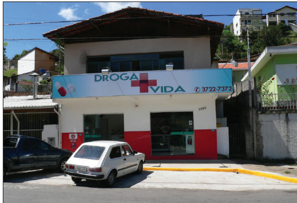
Droga Vida: mais uma opção em farmácia para os moradores da Zona Leste

LINHA COMPLETA - A Droga Vida , além dos remédios e medicamentos, também vai oferecer perflu-