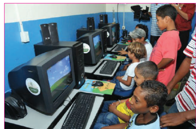
Crianças beneficiadas pela iniciativa do Cecafé

O Cecafé (Conselho dos Exportadores de Café do Brasil), coordenador do projeto, estima que a nova sala atenda mais de 40 pessoas, entre jovens e crianças. Outras 110 salas que fazem parte do programa estão implantadas na rede pública de ensino e beneficiam cerca de 35 mil alunos dos ensinos infantil e fundamental, incluindo os da zona rural. Atualmente, o "Criança do Café na Escola" está presente em seis Estados: São Paulo, Minas Gerais, Espírito Santo,