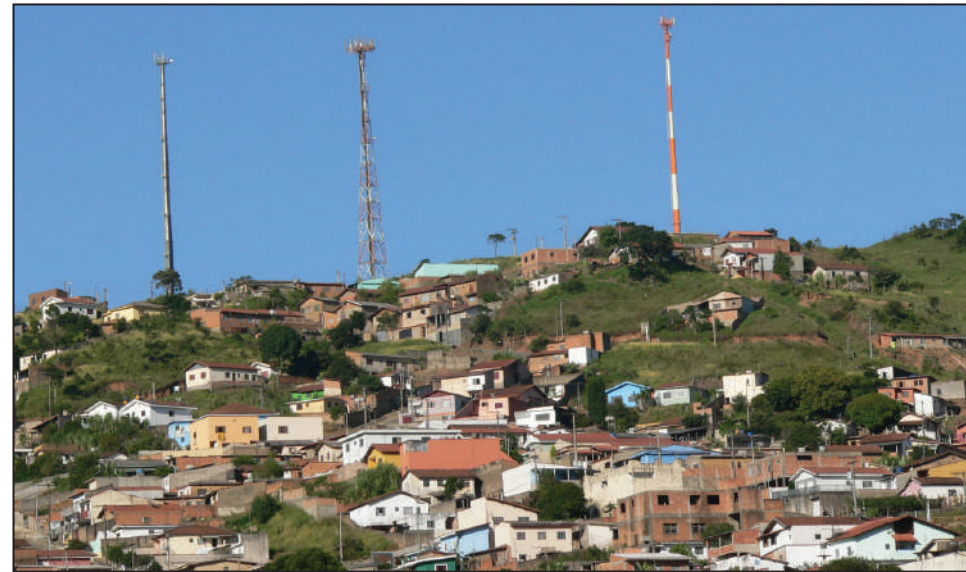
Jd. Colinas: Situação precária se prolonga por décadas e prejudica moradores