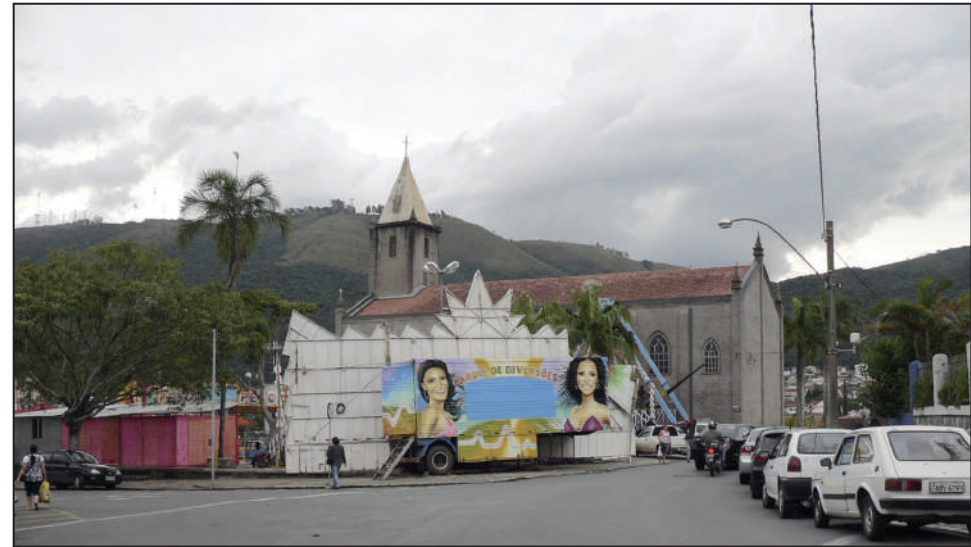
São Benedito: barracas e os brinquedos já estão prontos para os dias da festança

A Eletronuclear, subsidiária de Furnas responsável pelo programa nuclear brasileiro, anunciou que o Sul de Minas pode abrigar uma das usinas atômicas que vão ser construídas nos próximos anos. O anúncio gerou expectativas das mais diversas. Última página.