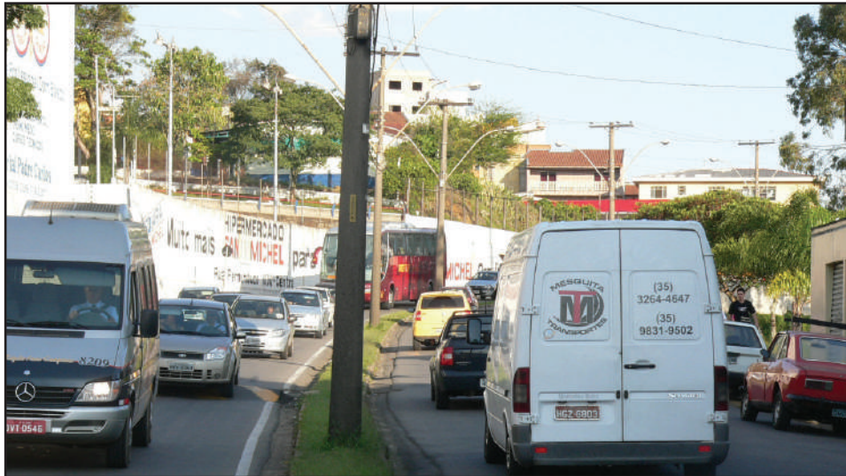
Cada vez pior: trânsito na Zona Leste está cada vez mais complicado