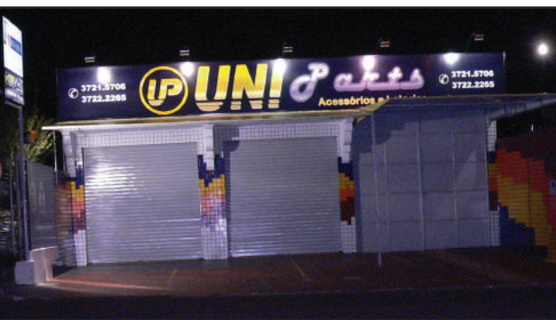
Fachada da UniParts: mais uma opção na região