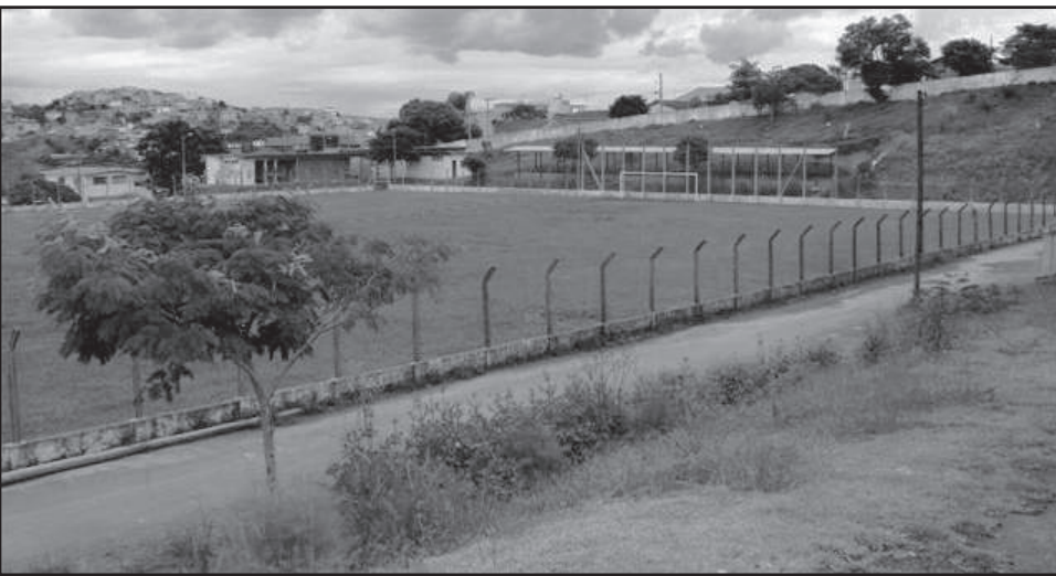
Parque aquático no estádio Megalão: mais uma sugestão de Urutu