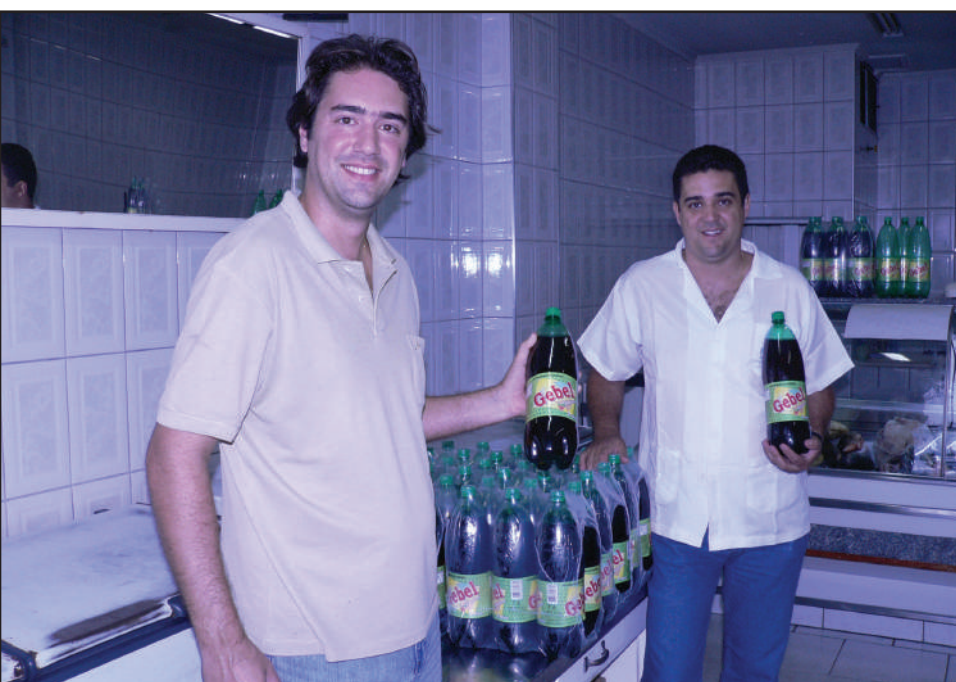
Ele voltou e já está na mão: guaraná Gebel vais disputar segmento top de linha