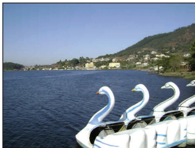
Represa Bortolan é uma das mais poluídas da cidade

Já na Bacia de Águas Claras foi detectada a presença de agrotóxicos em 63 vezes mais do que o valor considerado limite pelos órgãos ambientais.