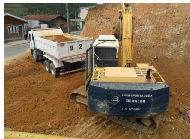
Acima, escavadeira Komatsu, da Transportadora Beraldo

O bar, depois de concluído, terá área aproximada de 200 metros quadrados e será um dos mais modernos e aconchegantes da região.