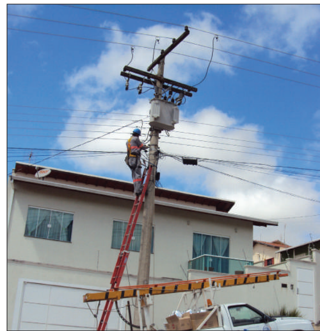
A iluminação foi melhorada em oito bairros da cidade

De acordo com a concessionária, o projeto prevê a substituição das lâmpadas de 125 W mercúrio (amarelo), por lâmpadas 100 W, vapor metálica (branco). Além disso, os braços instalados nos postes, que atualmente são do tipo curto, serão trocados por braços tipo II longo com luminárias fechadas, modelos que oferecem melhor distribuição da luz. Serão contemplados cerca de 1.040 pontos de iluminação. "O sistema com luminárias fechadas e braços