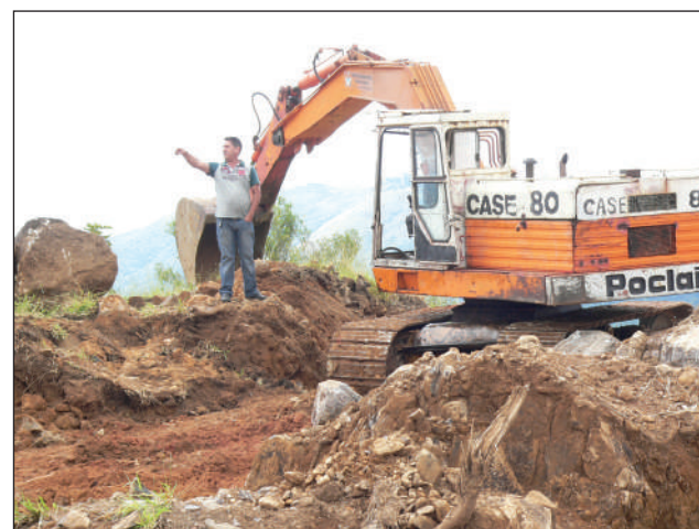
Acima, a Poclair da Prefeitura