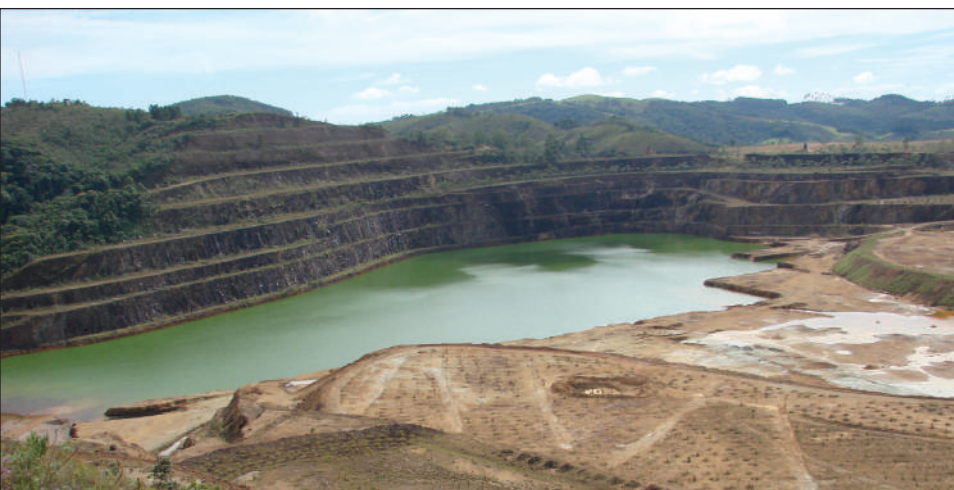
Local de onde saíram as primeiras cargas de urânio para as usinas brasileiras