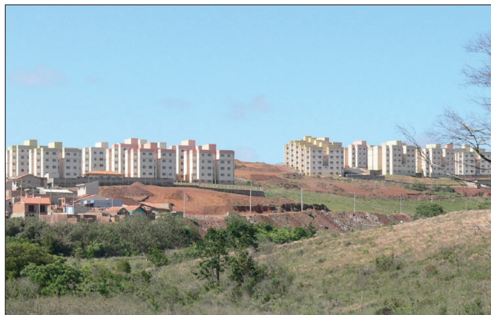
Conjunto residencial no Itamaraty: realizando o sonho da casa própria