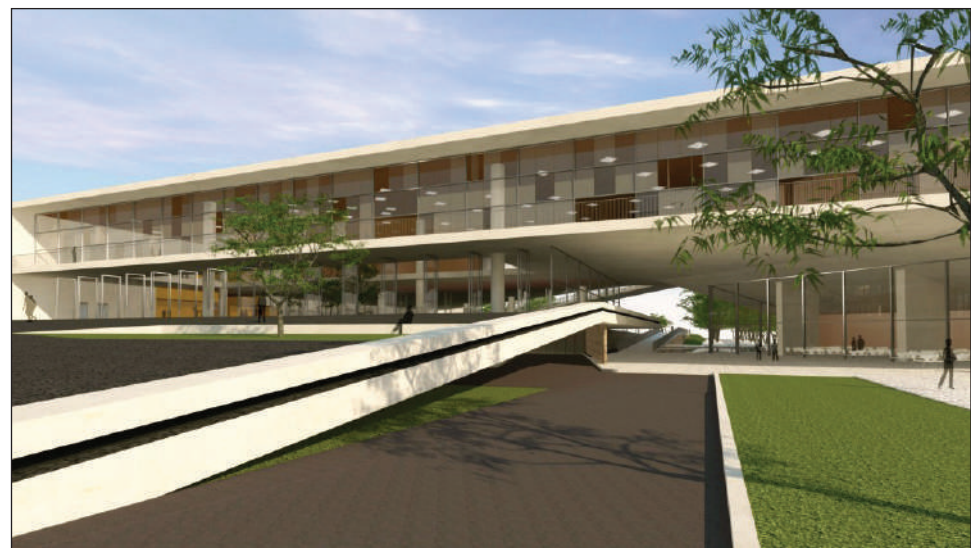
O expo Minas Poços ficará bem perto da Zona Leste e vai beneficiar a região

Silva destacou a importância da obra na geração de emprego e renda. Ele ressaltou que um investimento desta envergadura trará uma reação em cadeia, que beneficiará todo o trade turístico do município e chegará a todos os envolvidos, de hotéis a produtores rurais. O secretário Adjunto de Planejamento e Desenvol-