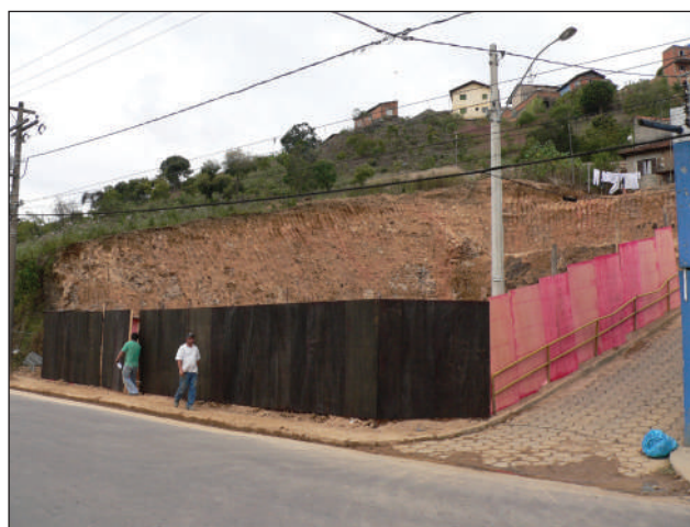
Os pedreiros já começaram as fundações