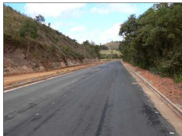
O asfaltamento da estrada da Cachoeirinha já foi concluído