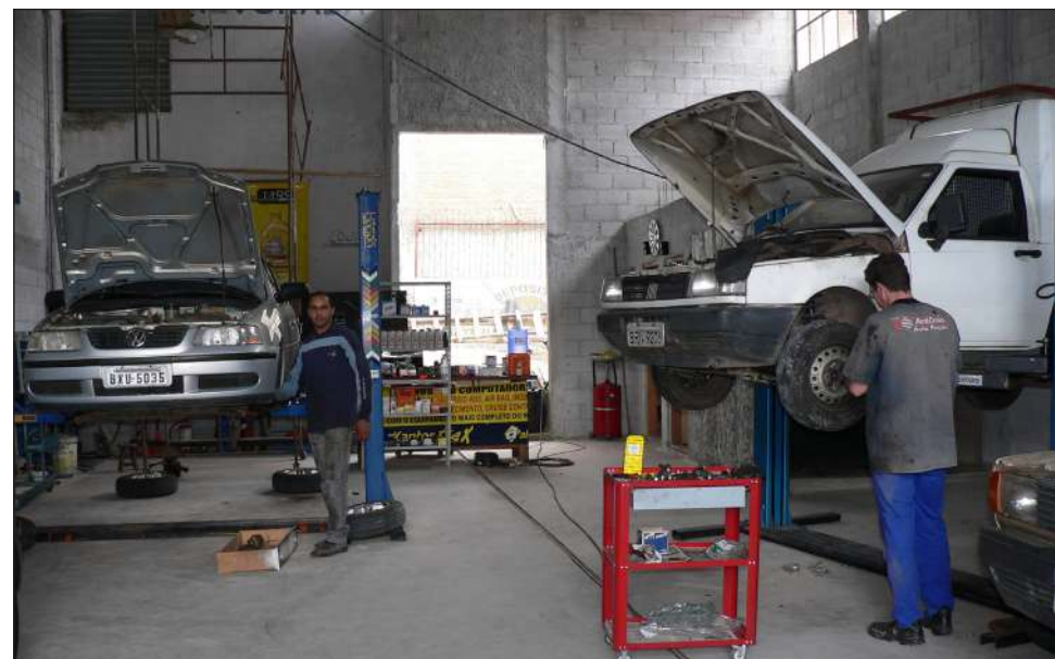
Qualidade total: A oficina Horion utiliza modernos equipamentos e ferramentas

ou utilizar-se de métodos arcaicos de manutenção. Vamos trazer todos os equipamentos para tornar os nossos serviços top de linha, oferecendo aos nossos clientes um serviço de alto nível. Somos especializados apenas na parte mecânica, tanto de veículos com injeção eletrônica, freios ABS e outras tecnologias embarcadas, como dos mais antigos, com carburador e sistemas tradicionais. O que importa é que os clientes sejam atendidos o mais rapidamente possível, com preços justos”, enfatizou Juciane.