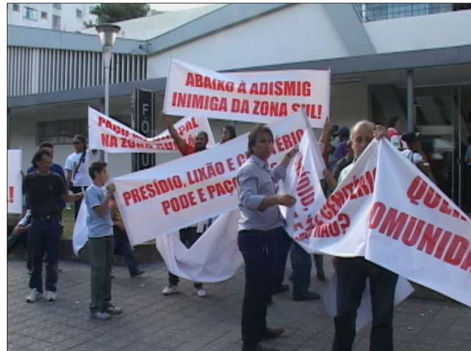
Moradores das zonas Sul e Leste foram protestar contra a Adismig durante a audiência no Fórum: interesses inconfessáveis

Até o momento, o município não obteve resposta quanto à defesa administrativa, mas entrou com mandado de segurança, cuja liminar foi expedida na quinta-feira, para que as obras possam ser reiniciadas. O processo foi