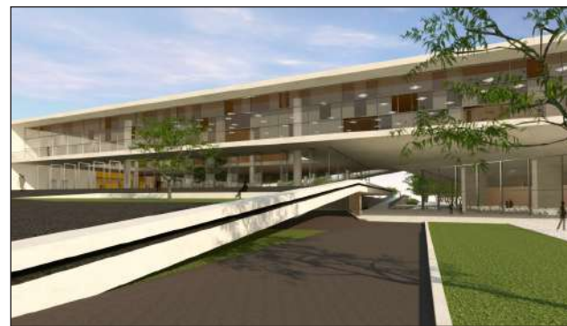
Sem desculpas: Agora, construção do Centro de Eventos pode ser iniciadas