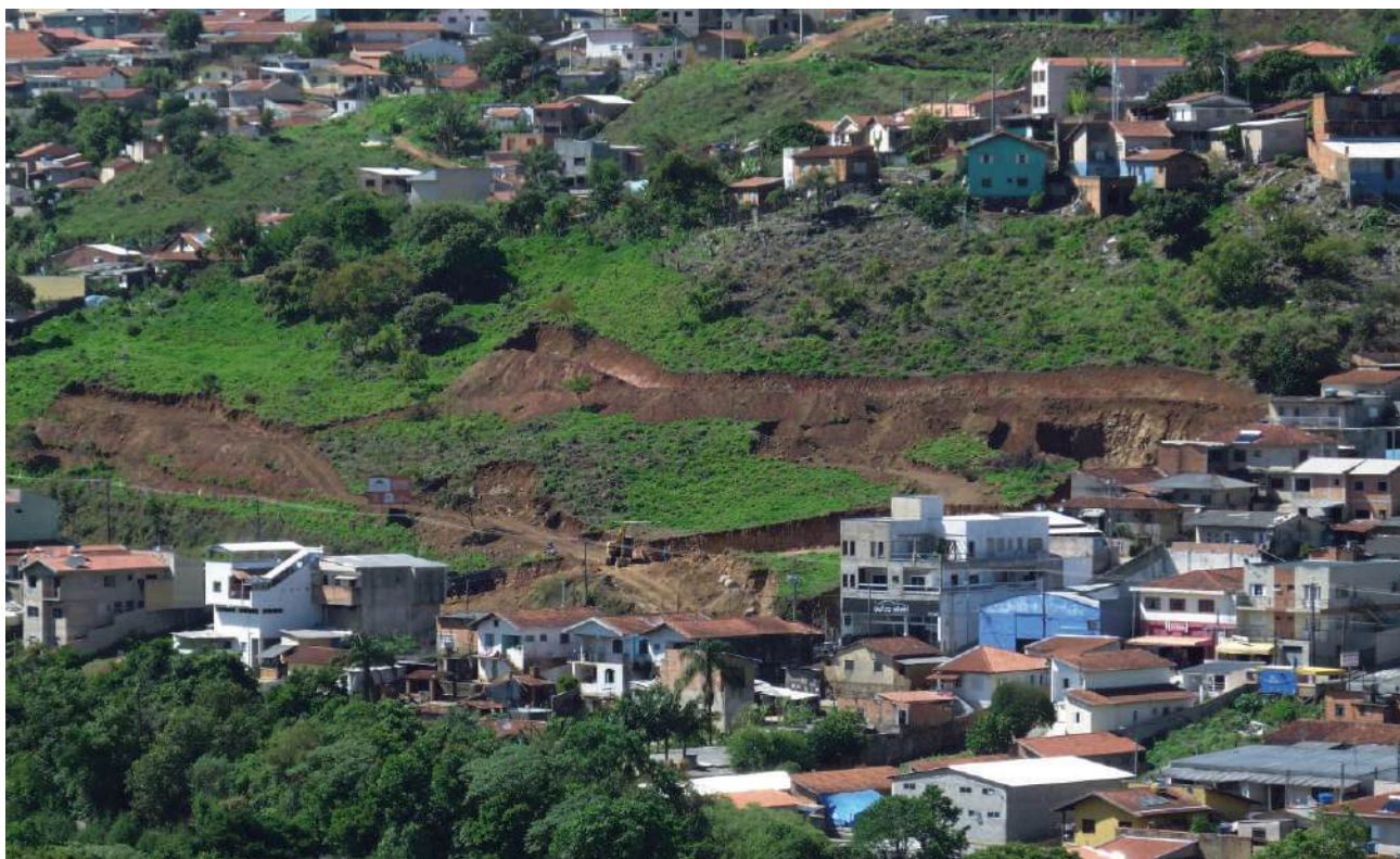
Uma nova paisagem surge no bairro Dom Bosco: mais de 5.000 viagens de caminhão serão retiradas para nivelar a área