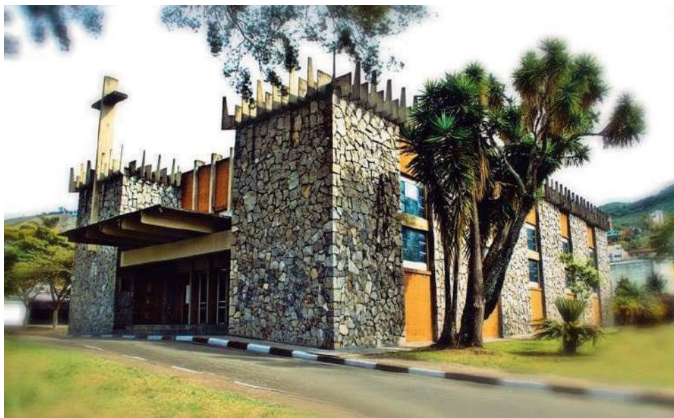
A paróquia de São Judas Tadeu fica no elegante Jd. dos Estados