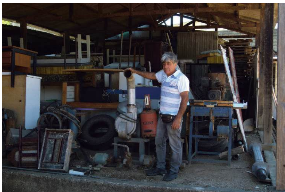
Divino agora conta com uma área mais adequada para o seu comércio na Zona Leste