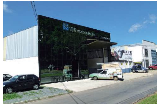
Uma mão na roda: VM facilita a vida de profissionais

A VM Vidros e Metais atende exclusivamente empresas e profissionais da construção civil e veio para "facilitar a vida" deles, já que antes este segmento era um dos mais problemáticos na cidade, que depende de fábrica situadas em outros municípios. A VM então veio para suprir esta carência e ser um centro de dis-