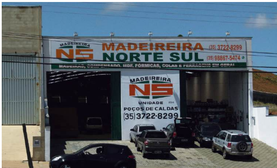
Madeiraira Norte Sul: a mais nova opção em madeiras e ferragens da cidade