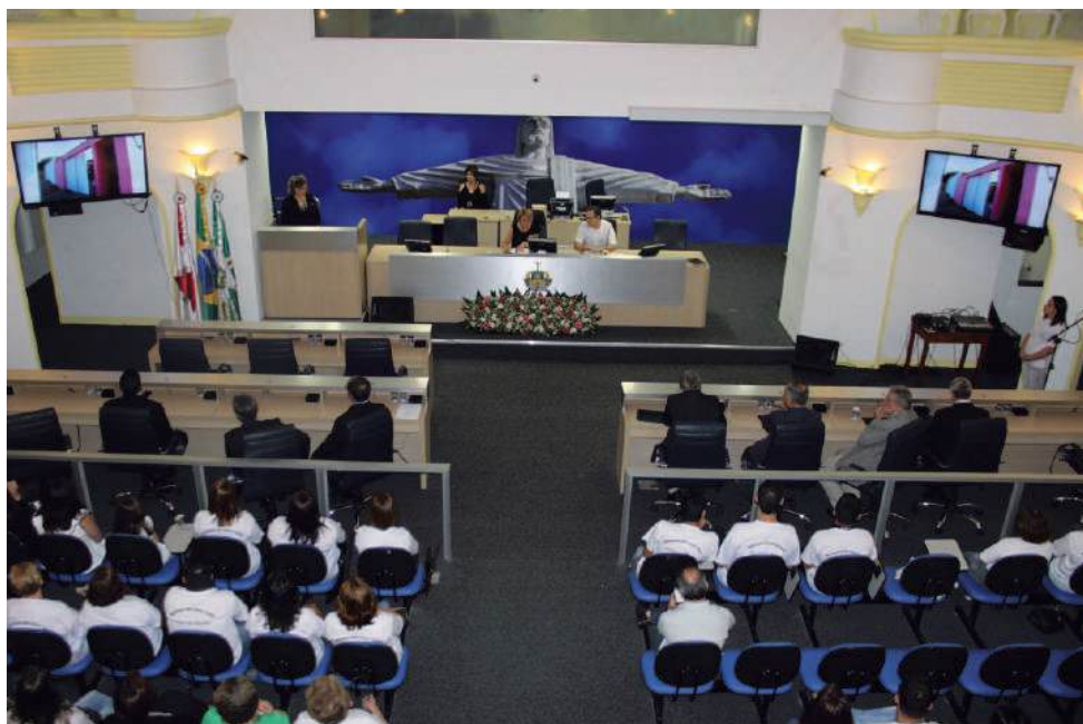
Câmara Municipal realizou sessão solene em homenagem à paróquia