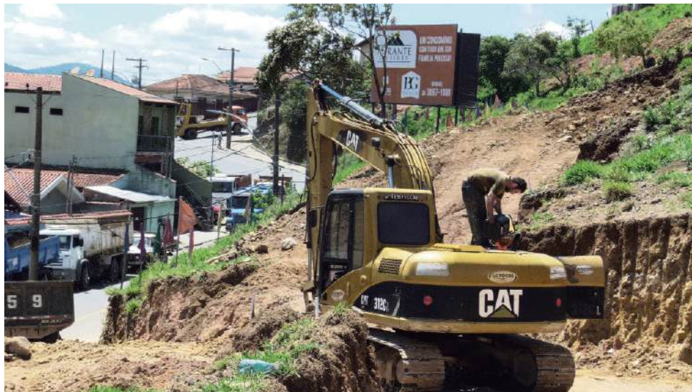
Ritmo acelerado: Serviço de terraplenagem já começaram e darão novo visual a área