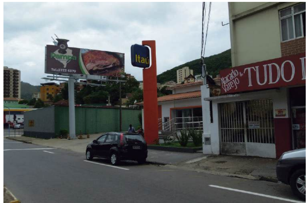
Algo de novo no ar: outdoor do Pampa se destaca na paisagem da Zona Leste

Rua Cel. Virgílio Silva 3412 - Dom Bosco ( 3713-3745