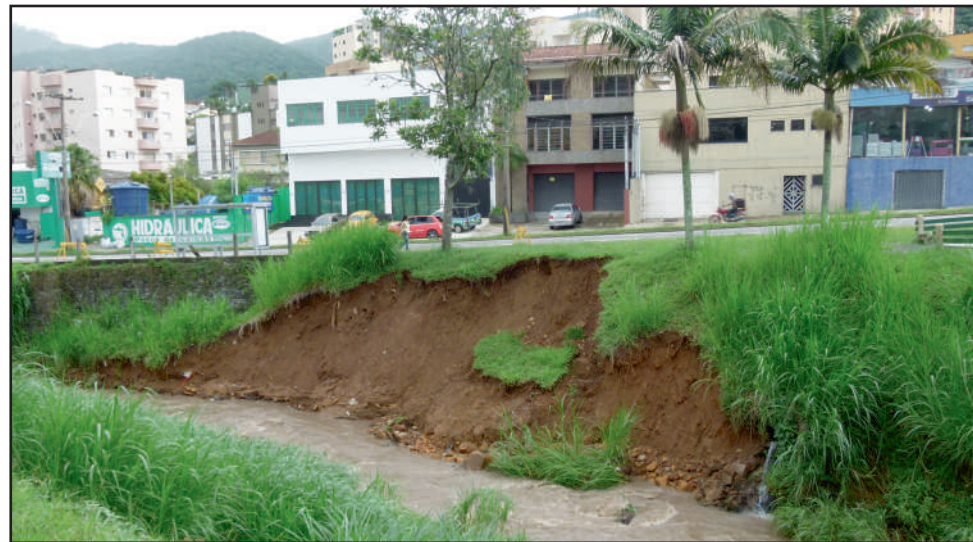
Aos poucos, o ribeirão da Serra vai solapando a Av. José Remígio Prézia

O trânsito continua sendo um dos problemas mais graves da Zona Leste, já que a maior parte das ruas não comporta o atual volume de tráfego de veículos. Com a volta das aulas, a situação está mais complicada - principalmente nas frentes das suas maiores escolas. No Colégio Dom Bosco, a situação é ainda pior, já que o número de veículos é enorme e a rua, estreita. Mais um caso que não terá solução no curto prazo, apesar das reclamações.