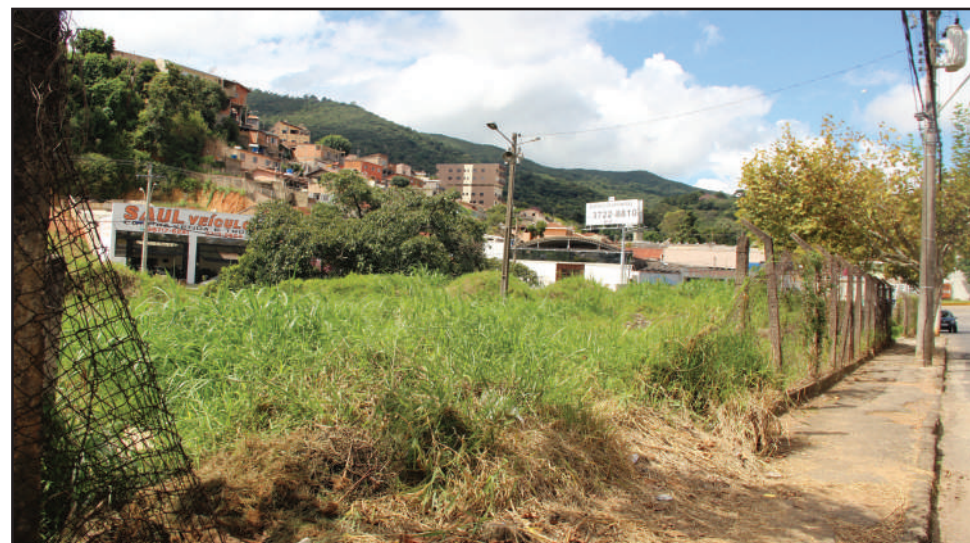
Retratos do abandono: mato tomam conta do entorno do CSU e assusta moradores