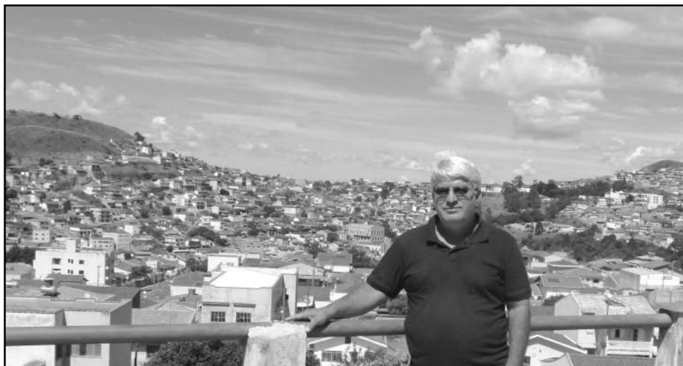
A Zona Leste pode muito mais: novo administrador regional está otimista