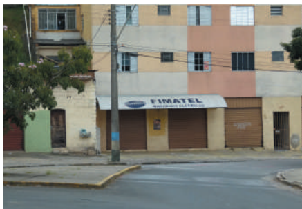
Efeitos da crise: Fimatel encerrou suas atividades