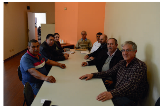
Apicultores destacaram a importância do setor

A Prefeitura deve, ainda, estimular a associação para conseguir um local adequado para o processamento do mel, dentro das normas da