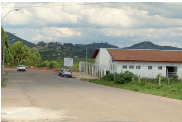
Nova escola ficará ao lado da UBS Itamaraty