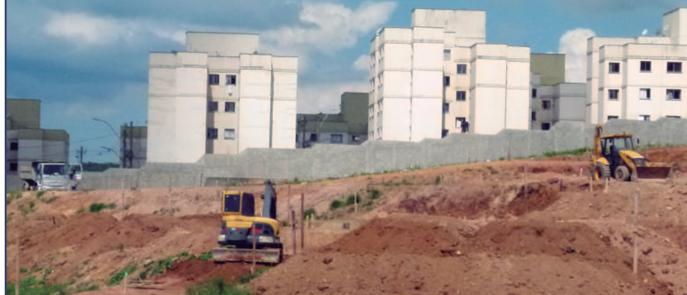
Máquinas e homens da Construtora BM já trabalham nas obras dos novos prédios no Itamaraty

A Zona Leste vai ter em breve mais 250 apartamentos do programa Minha Casa, Minha vida. Os prédios serão construídos no bairro Itamaraty 5, ao lado dos dois conjuntos inaugurados há alguns anos no mesmo bairro pela Construtora BM, do ex prefeito Luiz Antônio Batista. Veja mais detalhes na página 4.