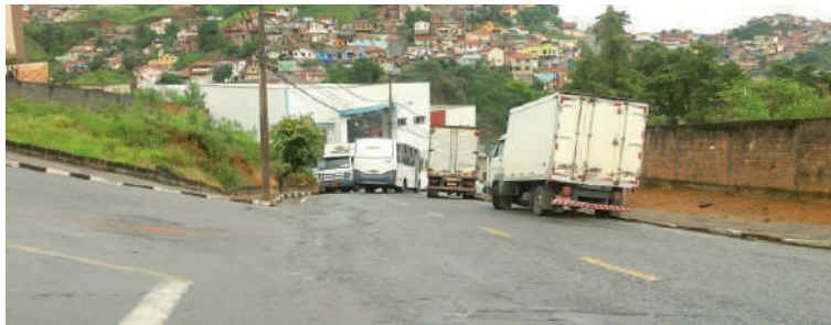
Situação preocupante: concentração de caminhões em local inadequado preocupa moradores