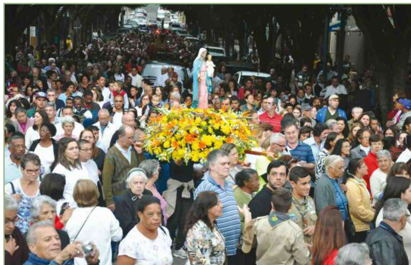
Por décadas, a população de Poços e região se encontram na Festa de São Benedito