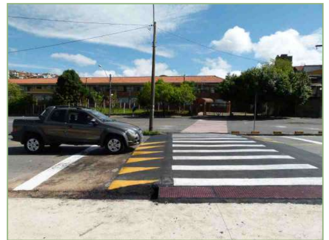
Travessia elevada melhora a segurança na região da Escola Municipal Edir Frayha, no Nova Aurora