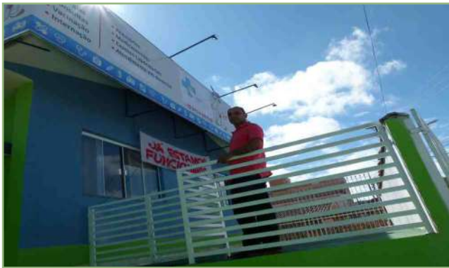
A Uni Patas é a mais nova clínica veterinária da região