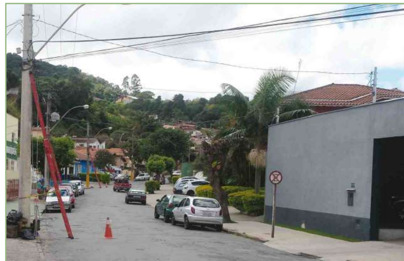
A Oi vai substituir toda sua rede metálica por cabos de fibra ótica em toda cidade

A Festa de São Benedito é o evento religioso e folclórico mais tradicional de Poços de Caldas, reunindo anualmente grandes multidões ao longo das duas semanas de sua realização. Neste ano, os organizadores estão dando ênfase especial nos aspectos da religião e da história. Veja a programação completa na última página.