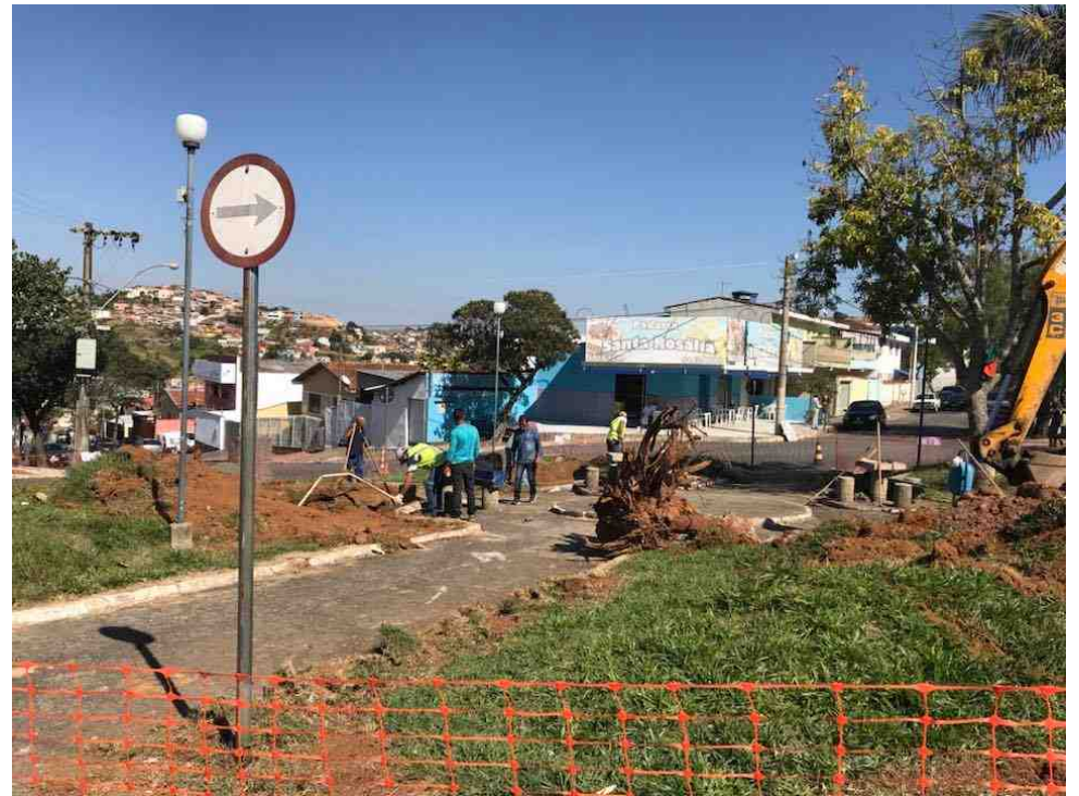
A praça do rodalão do Santa Rosália passa por revitalização e remodelação

RUA CEL VIRGÍLIO SILVA, 2.666 - EM FRENTE AO PARQUINHO DO DOM BOSCO