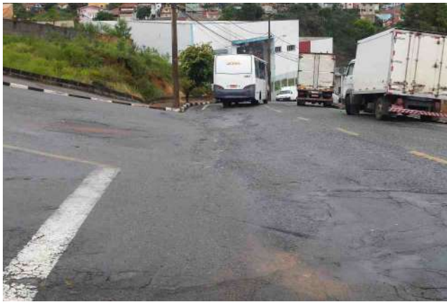
Acesso à serra do Selado está há quase 30 anos sem receber manutenção