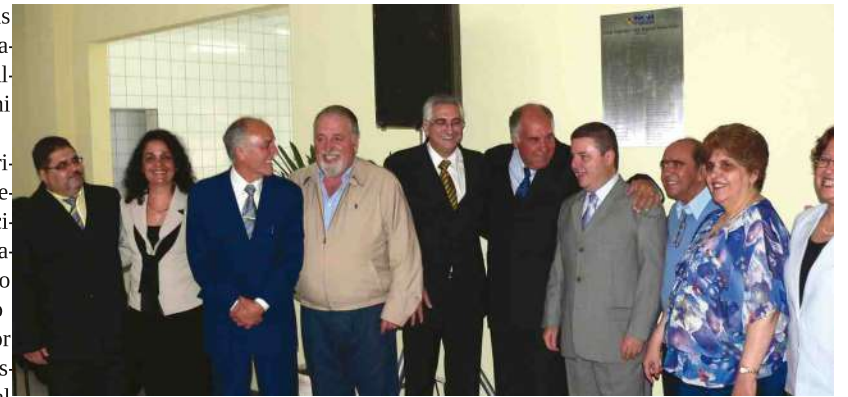
Ocasão da inauguração da escola, em 4 de setembro de 2009, que contou com a visita do então governador Antônio Anastasia (PSDB)

Em resposta ao Legislativo, a Prefeitura, através da Secretaria de Educação, esclareceu que não existe no momento contrato vigente para manutenção de elevadores. No entanto, a administração ressaltou que foi solicitada ao Programa Dinheiro Direto na Escola (PDDE), do