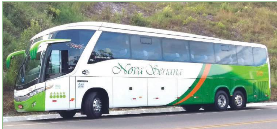
A empresa Nova Serrana assumiu as operações da Rápido Campinas na cidade

MALUCO MATA A SOGRA NO JD. SÃO PAULO O mês de abril começou triste na zona leste. Um rapaz de 22 anos botou fogo na casa de sua sogra, com ela dentro. Veja mais detalhes na página da TZL no Facebook!