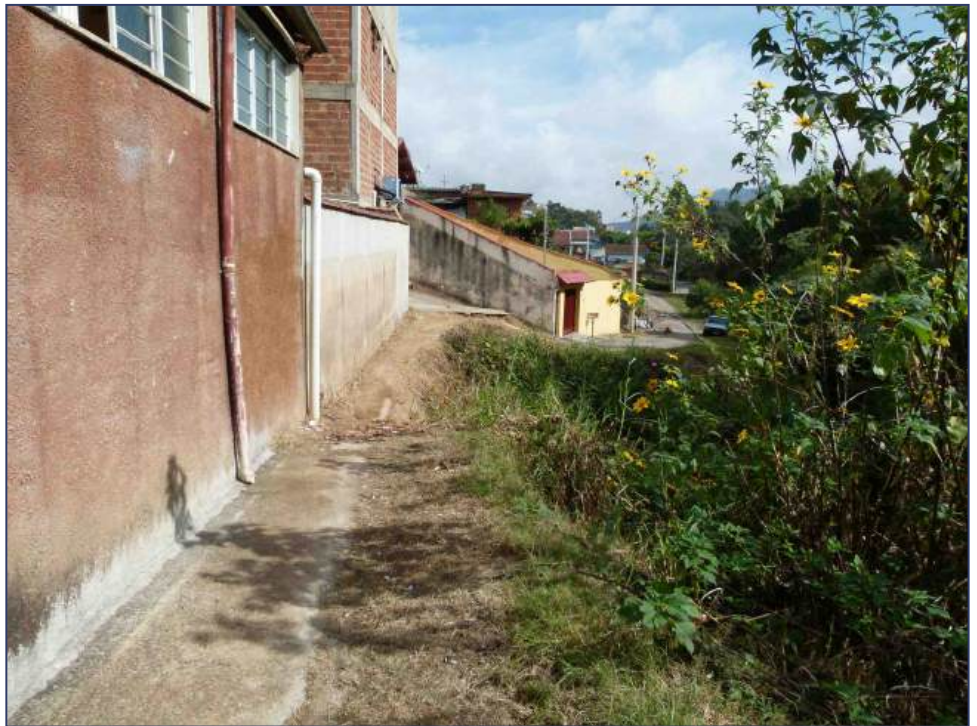
Nem pedestres estão passando: trecho da rua foi totalmente carregado pela erosão e muitos anos de abandono

Os moradores da Rua Claudina Brandina de Moraes, no bairro Augusto de Almeida, são uns dos mais injustiçados de Poços de Caldas. Apesar de pagarem os mesmos impostos e taxas como qualquer outro cidadão local, não possuem o principal: a própria rua. Por ficar situada às margens do ribeirão da Serra, entre o parquinho do Dom Bosco até à Rua Lusitânia, quase metade dela já foi engolida pela erosão causada pela correnteza do córrego.