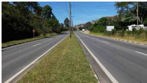
Av. Wenceslau Braz, dia 29 às 13 horas: totalmente vazia