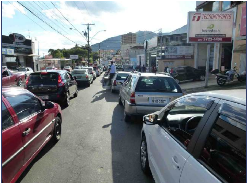
Quando a população soube que combustíveis estavam chegando ao Posto, gigantescas filas se formaram em todas as direções

Sem combustíveis e meios de transportes, todas empresas e profissionais que atuam na zona leste ficaram sem o que fazer. A maior parte das oficinas mecânicas ficou parada por falta de peças de reposição. Supermercados ficaram com estoques limitados e tiveram que impor cotas para não haver desabastecimento. Lojas ficaram praticamente sem clientes e só