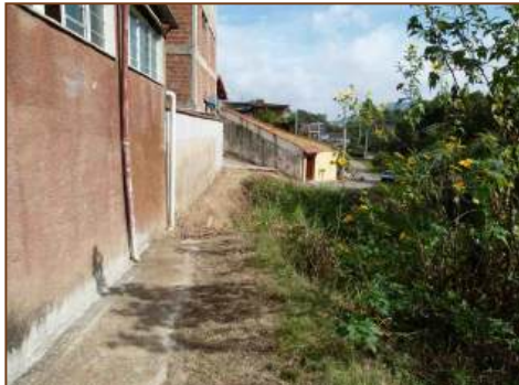
Judiação: erosão e irresponsabilidade da Prefeitura corroem um trecho inteiro da rua no Augusto de Almeida