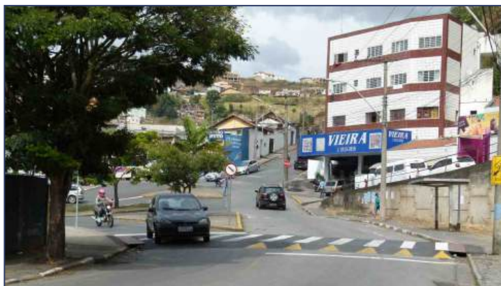
Passagens elevadas eram uma antiga reivindicação dos moradores