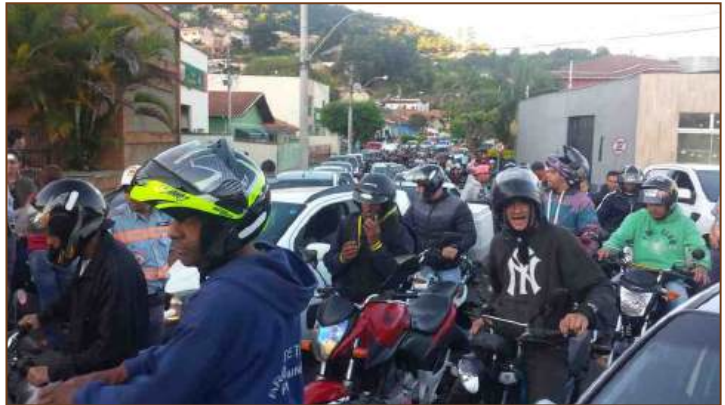
Dia 29 de maio de 2018 - uma data que vai entrar para história: multidão aguarda para abastecer no Posto Pampa

Dia após dia, ano após ano, um trecho da Rua Claudina Brandina de Moraes, no bairro Augusto de Almeida, está desaparecendo do mapa. Por estar margeando o ribeirão da Serra, a erosão provocada pelas águas vão lentamente levando pedaços da rua. Nos últimos dias, o trecho atrás do Colombo teve 100% de sua área removida e já não se pode passar de um lado para outro. Página 5