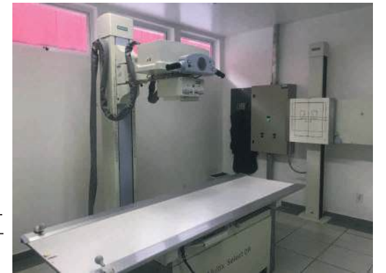
Os novos aparelhos de raio X são de última geração e vão trazer grandes melhorias no atendimento à população na UPA