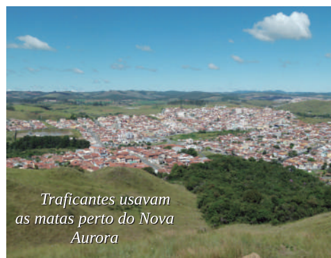
Traficantes usavam as matas perto do Nova Aurora

Bem ao estilos dos traficantes dos morros cariocas, que se valem de suas matas para esconder e vender drogas, um acampamento deste tipo foi descoberto na tarde desta última sexta-feira nas matas entre os bairros Nova Aurora e Monte Verde, aqui na Zona Leste. Depois de muitas investigações do setor de inteligência da corpora-