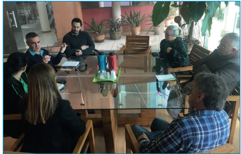
Reunião definiu a ação denominada “1 Minuto para o Meio Ambiente”