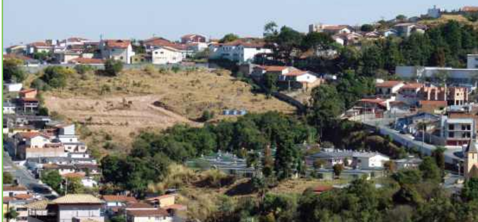
Terraplanagem do recinto de leilões já está pronta e agora começam as obras do curral

A Sociedade São Vicente de Paula, mantenedora do Lar dos Velinhos, está construindo um recinto de leilões na área ociosa situada acima das casinhas. O