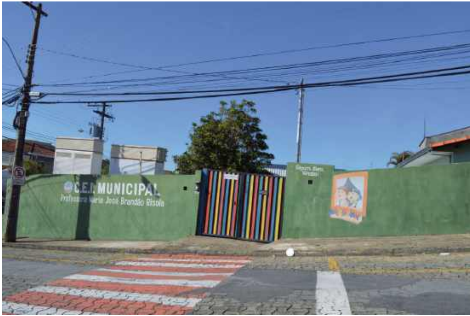
Unidade foi inaugurada em março de 1985 e está localizada no Jardim Ipê