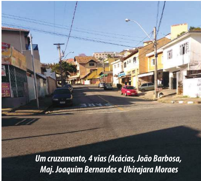
Um cruzamento, 4 vias (Acácias, João Barbosa, Maj. Joaquim Bernardes e Ubirajara Moraes)