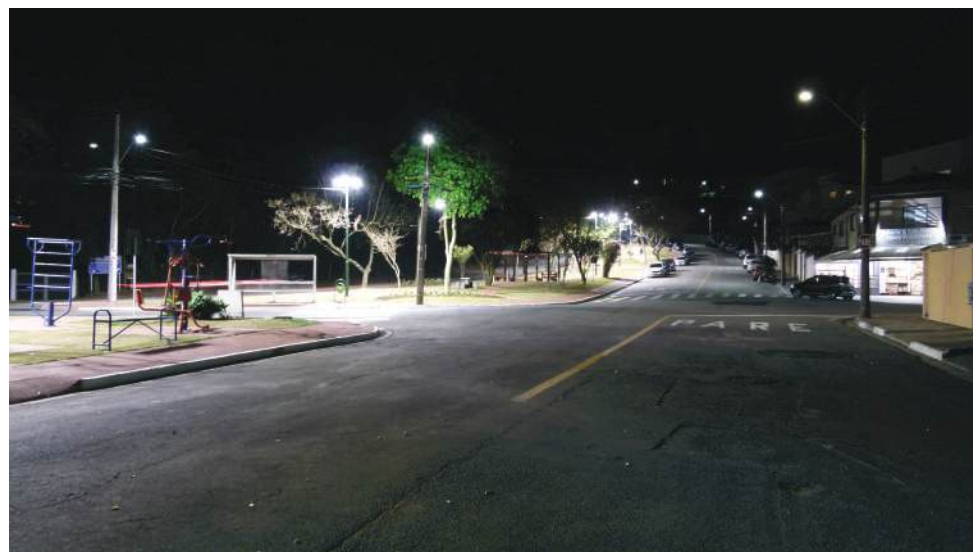
Muitas luzes e equipamentos urbanos: a reforma trouxe novo alento ao bairro