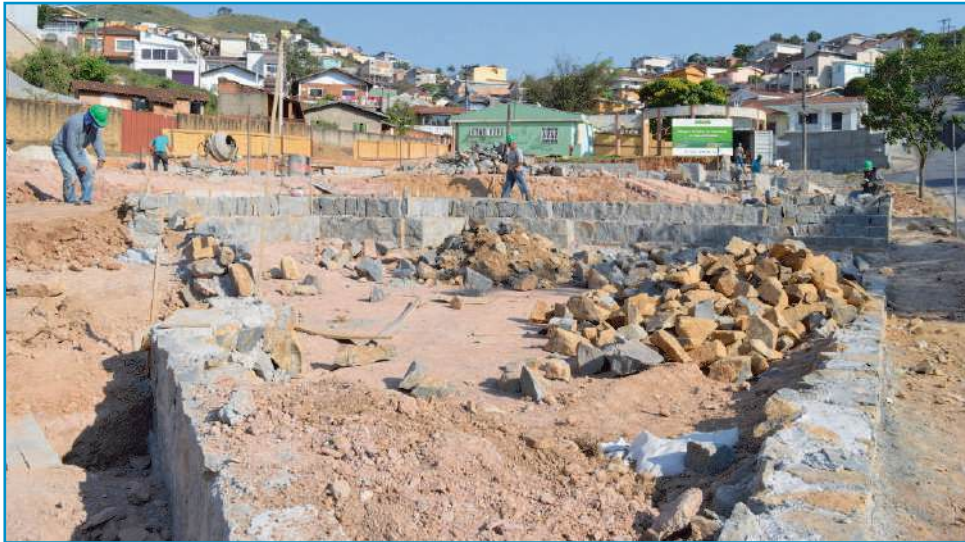
Depois de anos de abandono e descaso, a praça do Dom Bosco finalmente é reformada

A praça Ayrton Senna, em frente ao Lar dos Velinhos no bairro Dom Bosco, começa a ganhar vida novamente. No início de 2015 ela foi destruída por uma forte chuva. O ex-prefeito Dr. Eloísio recuperou a estrutura da praça, canalizando o córrego que passa sob a praça com tubulões de concreto - serviço bem feito e duradouro. Desde janeiro de 2017 o Prefeito Sérgio Azevedo buscava recursos para recuperar esse espaço de vivência tão importante para os moradores. Há um mês, com a liberação de recursos federais na ordem de