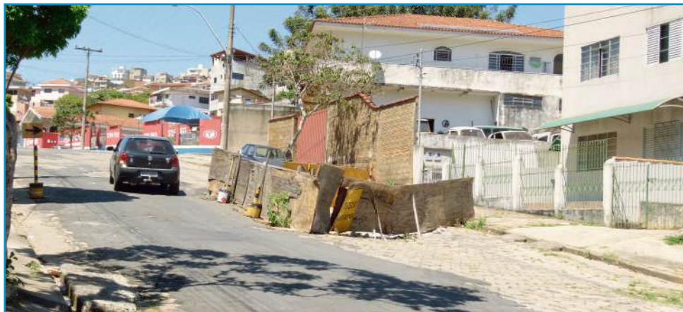
"Buraco da Av. Ubirajara" continua aberto no Jardim São Paulo há quase 2 anos