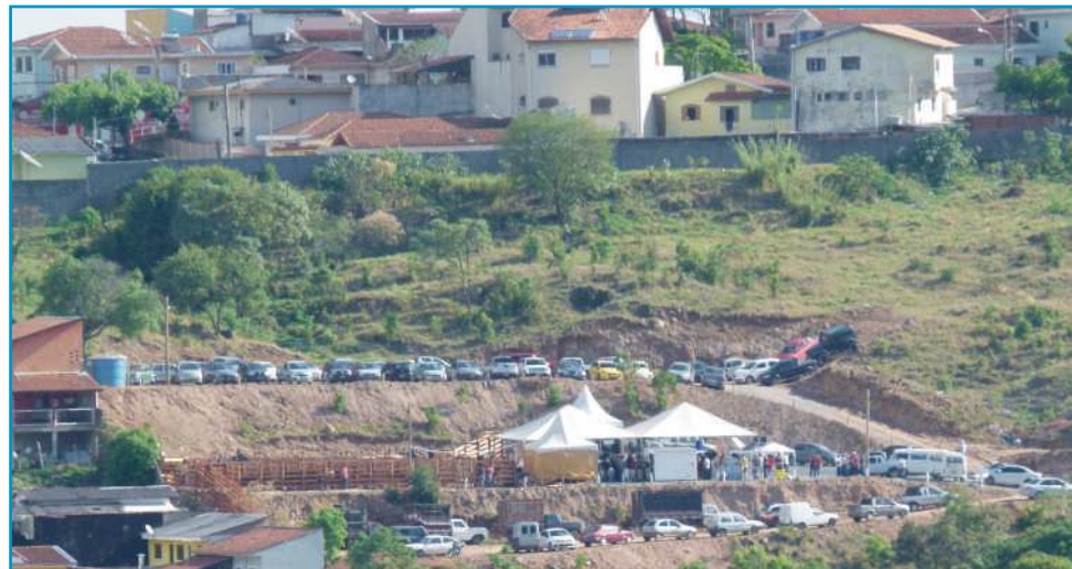
Sociedade São Vicente de Paulo agora tem um local adequado para os seus leilões

nua interdita, prejudicando o tráfego de veículos e os moradores. Os moradores temem que a situação se agrave com a aproximação de mais um período chuvoso.