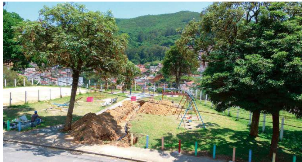
Moradores surpresos: buracos e valetas tomaram conta do parque infantil do bairro São João

crescendo forte e oferecendo uma excelente qualidade de vida aos seus moradores e visitantes. Sua diversificada economia é um de seus pontos fortes e a sustenta neste cenário.