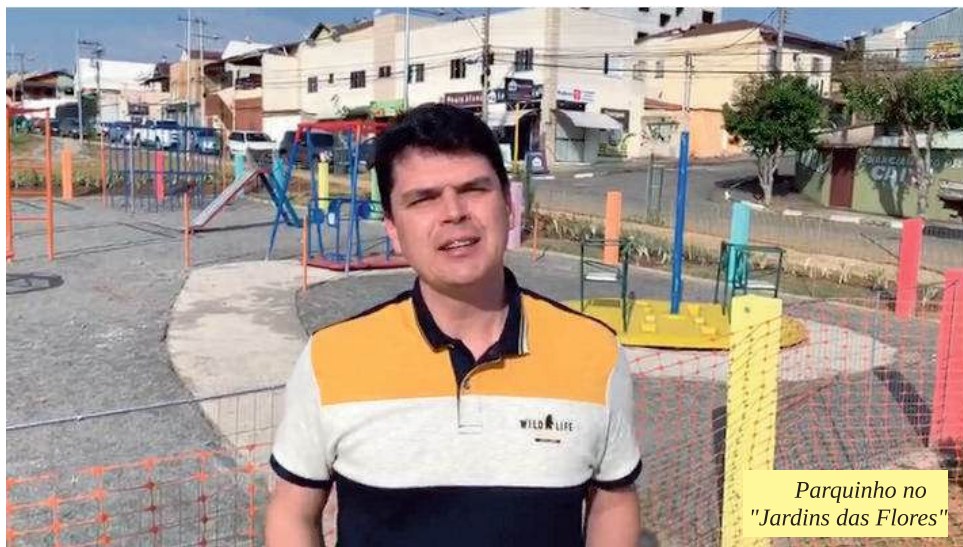
Parquinho no "Jardins das Flores"