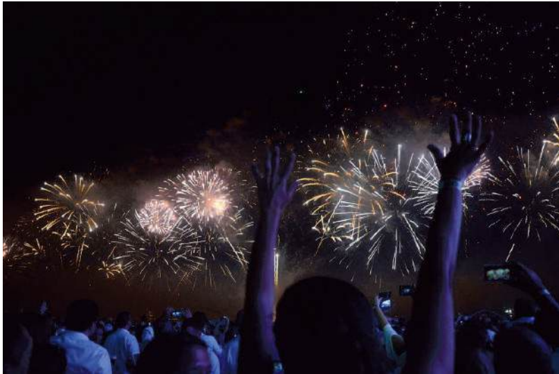
Poços de Caldas terá um show de som, luzes e brilho na chegada de do ano de 2020

A virada do ano em Poços vai ter várias atrações musicais a partir das 18h30 no dia 31 na Praça Pedro Sanches. Mais uma vez, haverá queima silenciosa de fogos de artifício. O evento