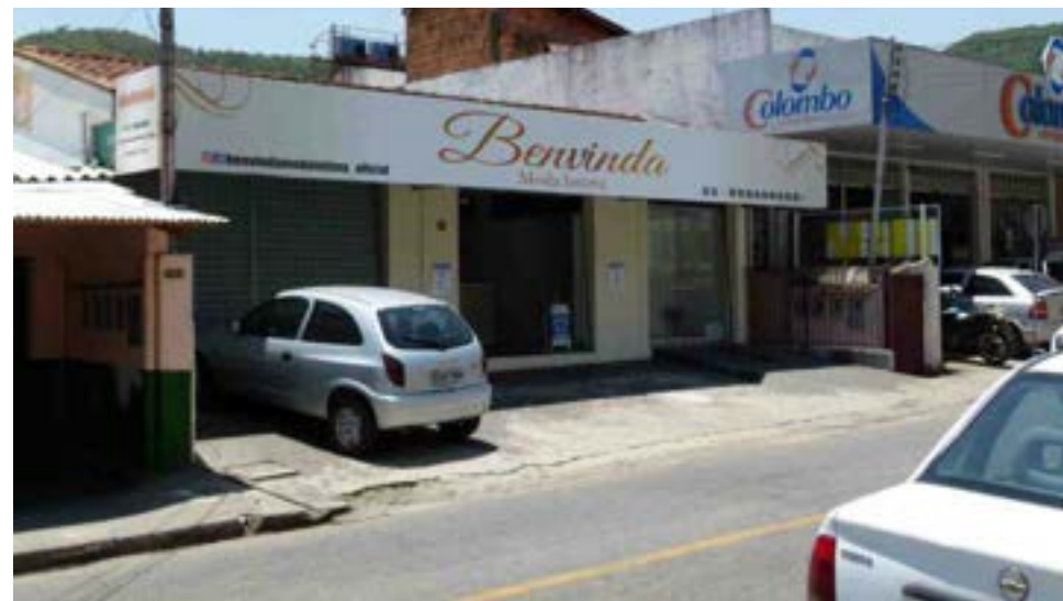
No local onde funcionava o Mini Shopping Dom Bosco hoje tem uma loja de lingerie