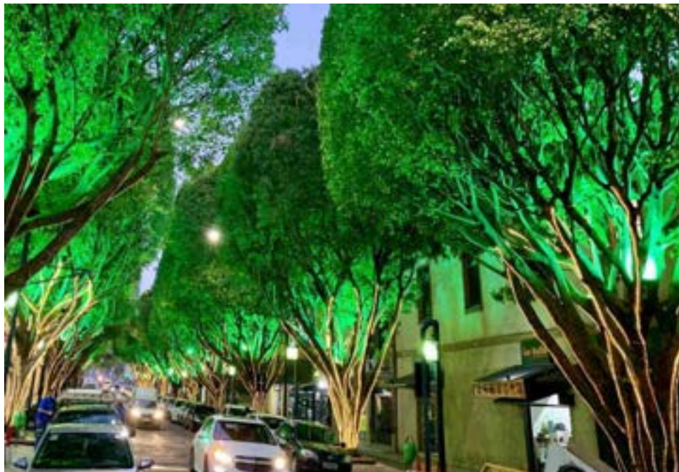
Quem passa pelo centro da cidade à noite já pode apreciar os enfeites natalinos

Este ano, a decoração natalina está sendo instalada mais cedo. Parte da iluminação já pode ser conferida por quem passa pelo centro da cidade à noite. E nesta sexta-feira (6), data do aniversário de 148 anos