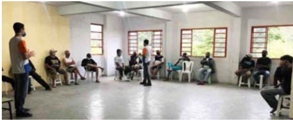
Voluntários da Alcoa ministraram palestras para atendidos da Casa de Passagem Trilhar