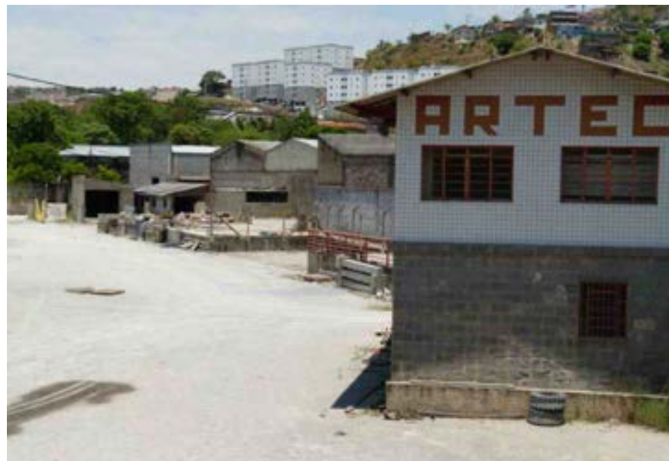
A Artec, que era ponto de referência da Zona Leste, agora só existe na lembrança

Assim como estas, muitas outras menos conhecidas e famosas também se foram. Com o passar do tempo, alguma outra empresa se instalou no local das finadas. Em outros casos, não. Outras empresas, como a Comercial Frigel, tiveram que tomar medidas de contenção e redução de despesas para continuar funciona-