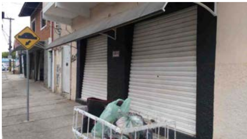
Muitas lojas foram duramente atingidas pela queda nas vendas e fecharam suas portas

Agora é torcer para que este maldito vírus seja enquadrado por vacinas ou remédios para que possamos buscar uma vida melhor para todos.