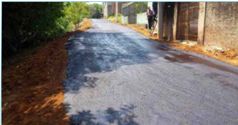
O asfaltamento destas ruas é aguardado há décadas no bairro Augusto de Almeida

Carga máxima autorizada a trafegar no trecho é de 7 toneladas levar nossas calçadas - que nem existe também", queixou-se. Ele disse que menos de uma semana depois de a lama ter sido colocada, já começou a trincar e com as poucas chuvas que caíram há alguns dias, alguns pedaços se descolaram.