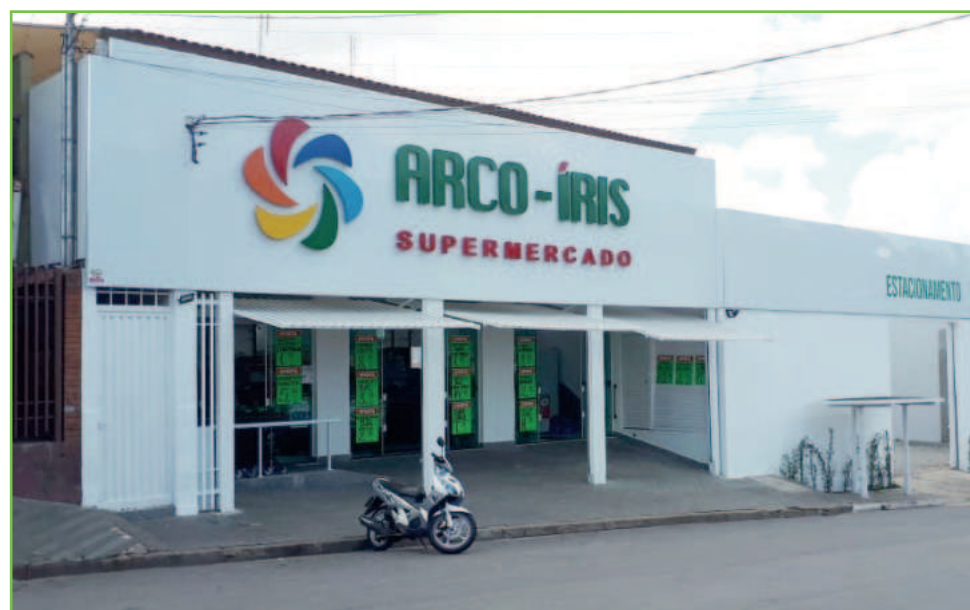
A nova loja do Arco Íris fica na Av. Sete de Setembro, 160 - bairro Nova Aparecida