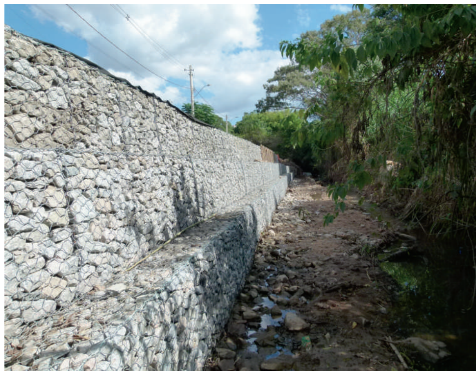
Serviço de qualidade: o muro gabião agora vai conter o barranco que sumia a cada chuva

Depois de muitos anos de reivindicações, os moradores da Rua Claudina Brandina de Moraes (que fica entre os bairros Dom Bosco e Augusto de Almeida) finalmente receberam uma obra de contenção decente e adequada. Um muro de contenção do tipo "gabião" foi construído entre o parquinho do Dom Bosco e a Rua Bahia. Agora os moradores das imediações terão mais tranquilidade, já que a rua estava desmoronando a cada chuva que caía na região.