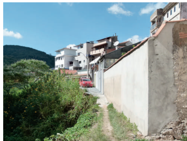
Não parece mas isso é uma rua no bairro Augusto de Almeida

As demais Indicações apresentadas pelo vereador tratam dos seguintes assuntos: construção de calçadas na rua Aníbal José dos Reis, Jardim Philadelphia; implantação do programa "Nosso Bairro está de Volta" no loteamento Jardim Santa Clara II e Jardim Philadelphia I; colocação de redutores de velocidade no Jardim Philadelphia I; ampliação de trecho que tem início no bairro Campos Elíseos e vai até o trevo do Santa Clara, na avenida Wenceslau Braz. Todas as matérias estão disponíveis para consulta no Portal da Câmara, em Proposições (Indicações n. 508/226/150/225/12/714).