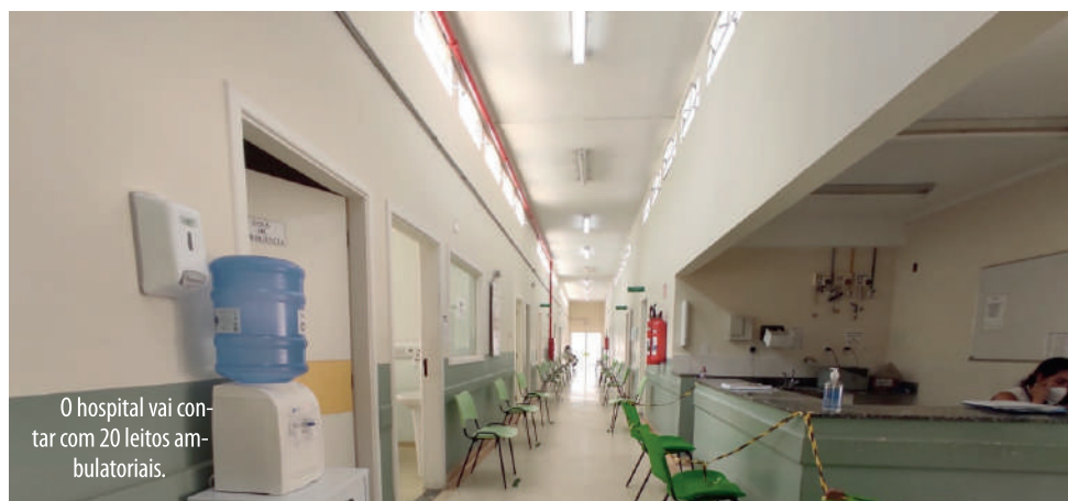
O hospital vai contar com 20 leitos ambulatoriais.