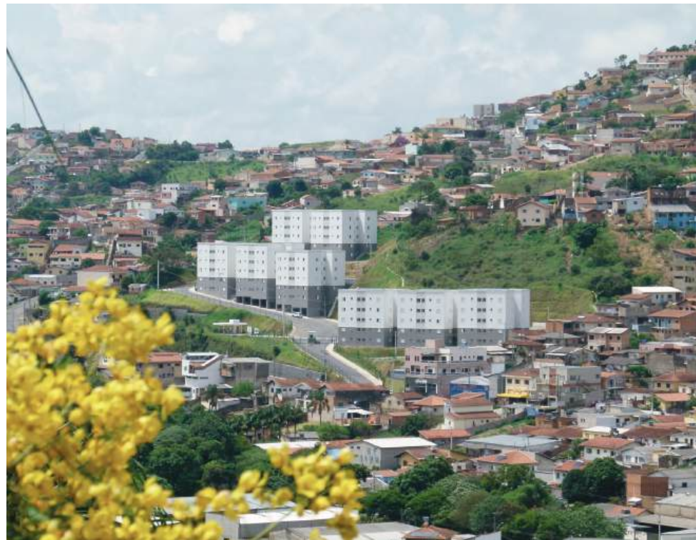
O condomínio Mirante da Serra foi o maior empreendimento imobiliário do Dom Bosco

A Tribuna da Zona Leste começa nesta edição uma série de reportagens sobre a situação dos bairros que a integram. A primeira região a ser abordada é a do maior e mais populoso bairro da Zona Leste - o dom Bosco. De forma sucinta, vamos mostrar as virtudes e os problemas enfrentados por quem mora ou trabalha no Dom Bosco e adjacências.