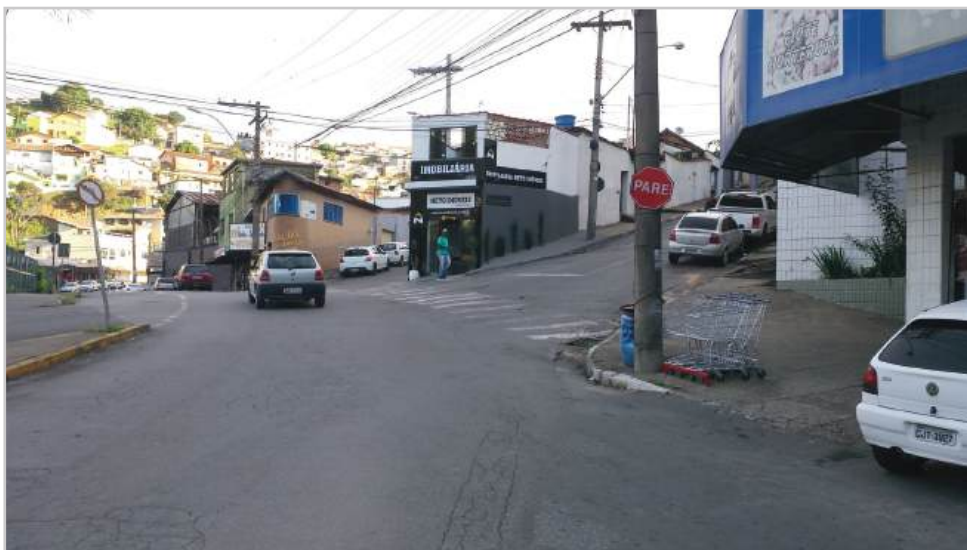
Zona Leste dificilmente terá ciclovia e poucas são as obras da Prefeitura na região