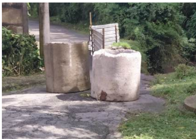
Tresco interditado da Rua Claudina Brandina de Moraes