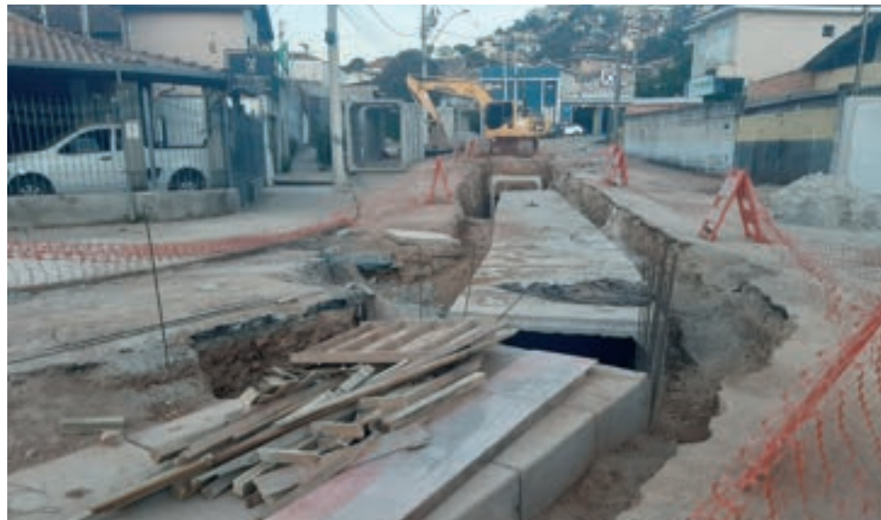
Poeira, tráfego interditado e prejuízos: moradores do José Carlos se queixam da demora

Materiais Refratários e montar uma planta para a extrair e exportar tais elementos. O projeto prevê a criação de 700 empregos diretos e entrar em efetiva operação a partir de 2016. O governador Zema veio à cidade para apresentar oficialmente a iniciativa. Pág. 7