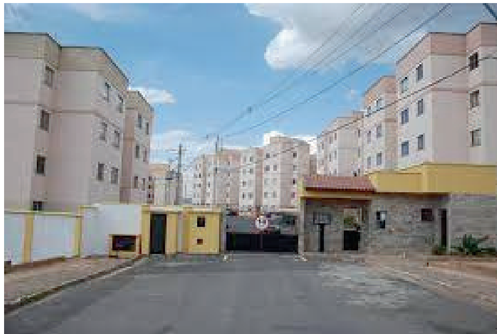
Moradores dos condomínios do Jd. Itamaraty 5 sofrem com a falta de elevadores

O parlamentar já repassou às Assessorias da Câmara as informações obtidas para que analisem a documentação e orientem os vereadores. “O Poder Legislativo, assim que recebeu a representação do Ministério Público de Contas, já deu celeridade às providências cabíveis. É uma situação que nos preocupa, pois trata-se de investigação sobre a possibilidade de irregularidades praticadas por um cartel de empresas de ônibus. Estamos no aguardo da conclusão dessa análise e também dos esclarecimentos solicitados à Prefeitura”, finalizou.