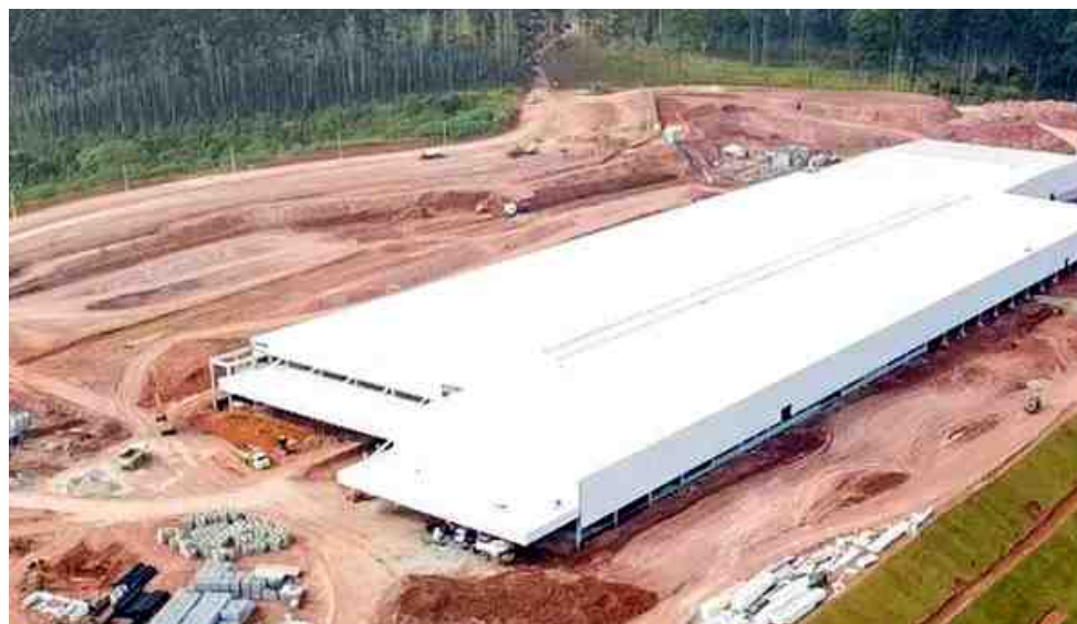
As obras na fábrica de louças sanitárias da Docol no DI foram feitas em tempo recorde