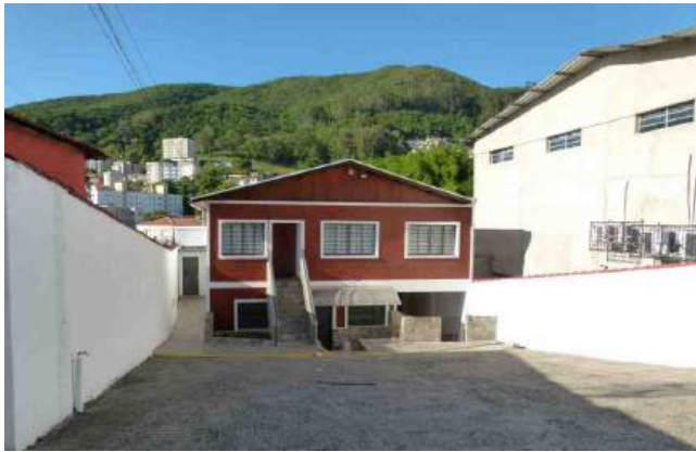
A sede do Sindicato dos Rodoviários fica na Vila Nova