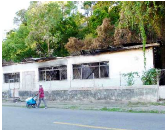
O fruto do abandono e descaso: antiga creche vira escombros