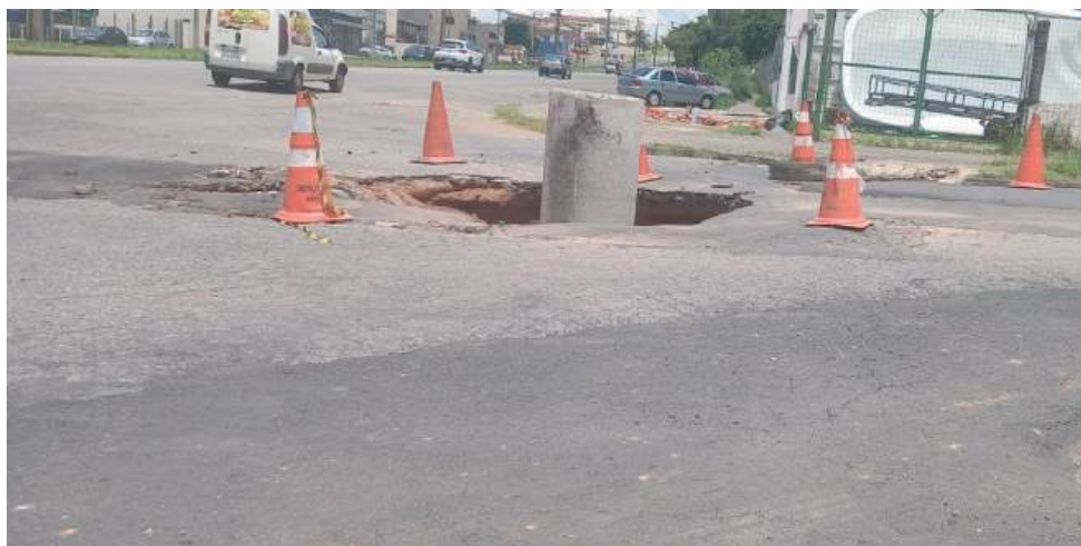
A cratera no bairro Jardim Philadelphia é mais uma para a coleção delas na Zona Leste