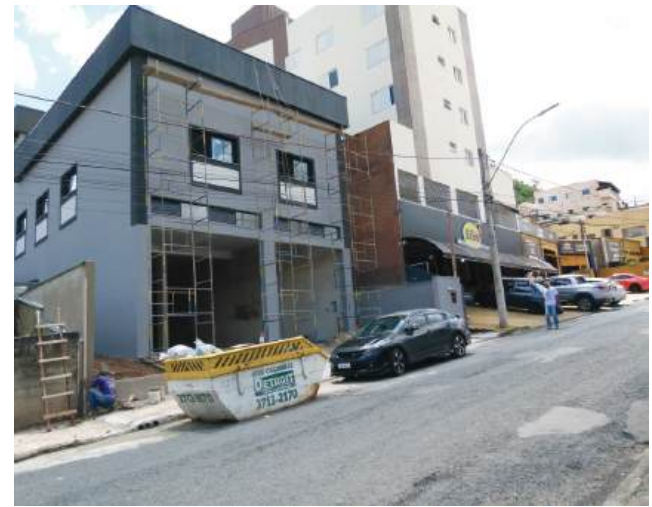
Ampliação da loja de materiais elétricos Elin na reta final