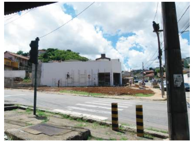
Instalações da Pag Menos, na Vila Nova, estão quase prontas

A Casa de Carnes Castelo faz de tudo para que os imprevistos de última hora não estraguem suas festas de final de ano. Encomende as carnes de sua ceia com antecedência e aproveite o melhor do Espírito Natalino.