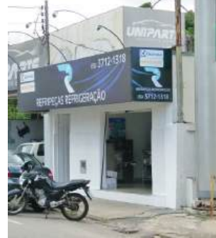
Nova loja da Refripeças

São apenas alguns casos que mostram que 2024 será bem melhor!