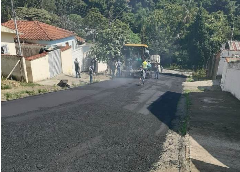
Recuperação das ruas serão realizada em diversos bairros da Zona Leste