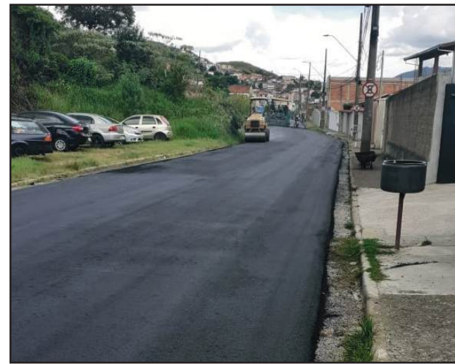
Várias ruas do Dom Bosco foram beneficiadas

o volume de investimentos que tivemos em épocas em que tínhamos um deputado de Poços em Brasília com o de hoje, é nítida a falta que faz a força de representatividade política. Conheço muito bem nossa cidade e a região; e garanto que a voz do povo daqui seja ouvida pelo governo federal e que as verbas cheguem para melhorar a vida das pessoas.”