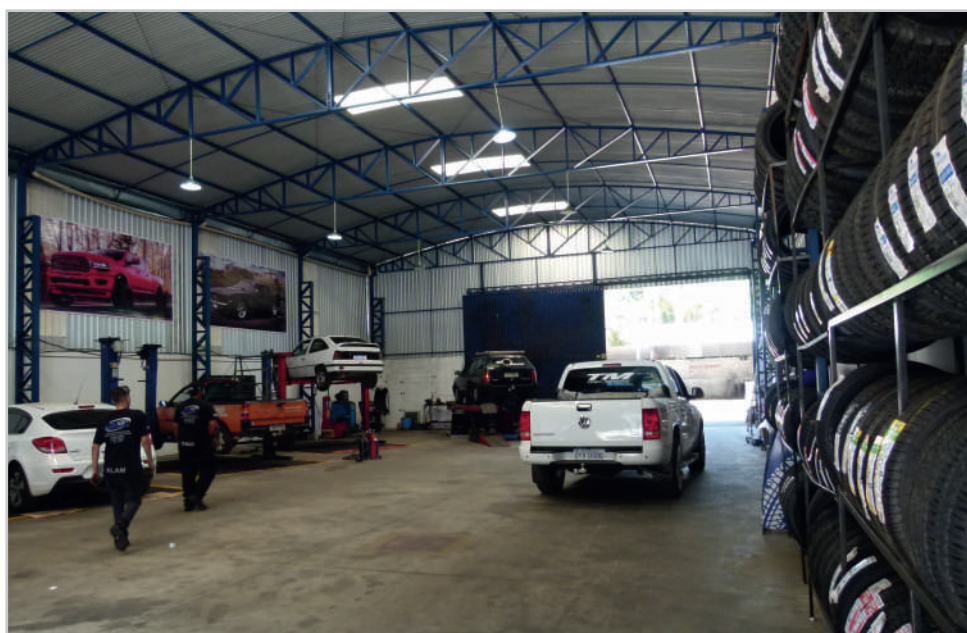
Mais conforto, segurança e comodidade: Amplo espaço vai permitir melhor atendimento

mais. Vocês podem ter certeza, podemos não ser a maior empresa do ramo, mas trabalhamos para ser a melhor”, finalizou o empreendedor.