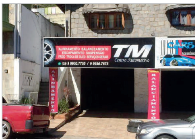
O começo de tudo: Muito aperto na Cel. Virgílio Silva

Muito mais espaço, conforto, comodidade e segurança: as novas instalações da TM ficam na Av. Presidente Wenceslau Braz, 1612, na Chácara Alvorada (Em frente ao Hospital da Zona Leste). Telefones 3712-6556 35 9 9930-7675