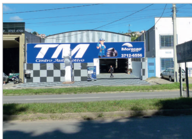
Novas instalações: Novos desafios, mais motivação