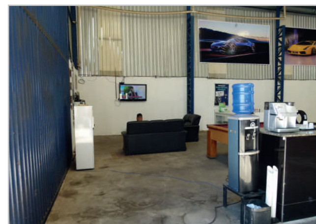
Espaço para espera para os clientes tem até mesa de bilhar