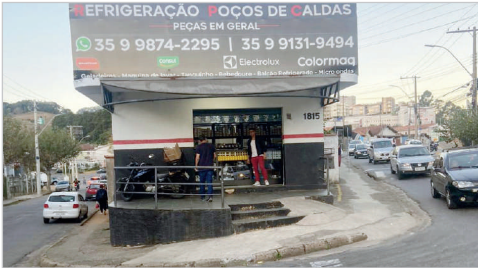
Refrigeração Poços de Caldas está situada nos dos pontos mais estratégicos da Zona Leste