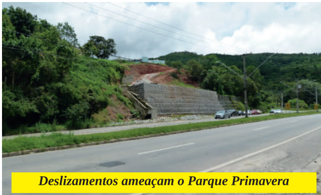
Deslizamentos ameaçam o Parque Primavera

Outro efeito que preocupa é a erosão ao longo do ribeirão da Serra, que piora a cada ano e a prefeitura nada faz a não ser ações esporádicas e emergenciais. Este método de trabalho trás grandes riscos aos moradores destas áreas.