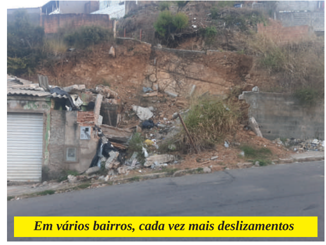
Em vários bairros, cada vez mais deslizamentos