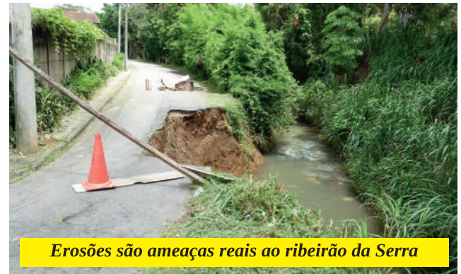
Erosões são ameaças reais ao ribeirão da Serra