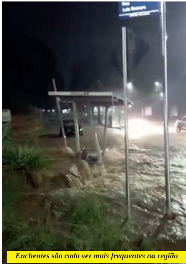
Enchentes são cada vez mais frequentes na região