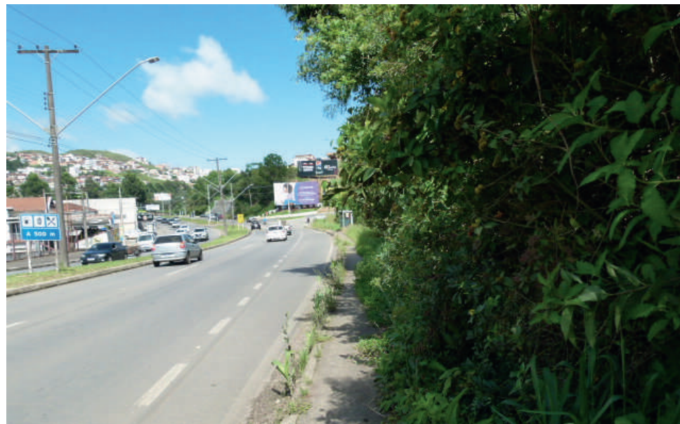
O trânsito é cada vez mais intenso e perigoso na Av. Presidente Wenceslau Braz

A fiscalização eletrônica visa dar mais segurança aos usuários da avenida. No últi-