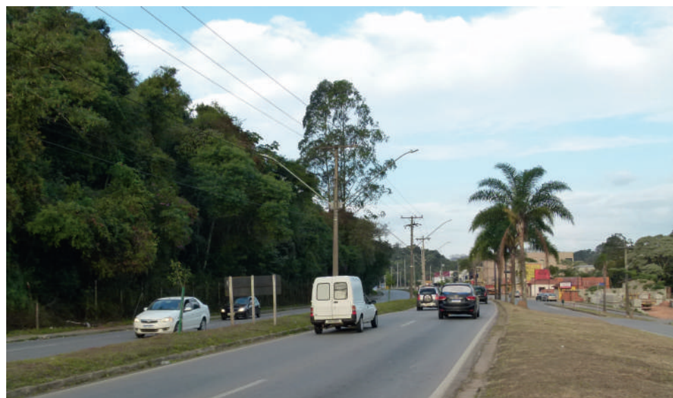
Principal via de acesso ao Sul de Minas / BH e RJ, na Av. Wenceslau Braz ocorrem muitos acidentes fatais

A Loteadora do Edinho está lançando um novo bairro nas imediações do trevo do Carretão, bem às margens da rodovia BR 459, já no município de Caldas. O novo bairro é uma iniciativa para diminuir o gigantesco déficit habitacional na região leste de Poços, que é "engessada" pela lei de zoneamento que proíbe ou dificulta o lançamento de novos loteamentos na região. Página 5