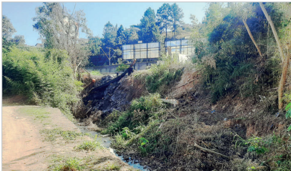
A situação mais perigosa, crítica e devastada do ribeirão da Serra está no bairro Dom Bosco