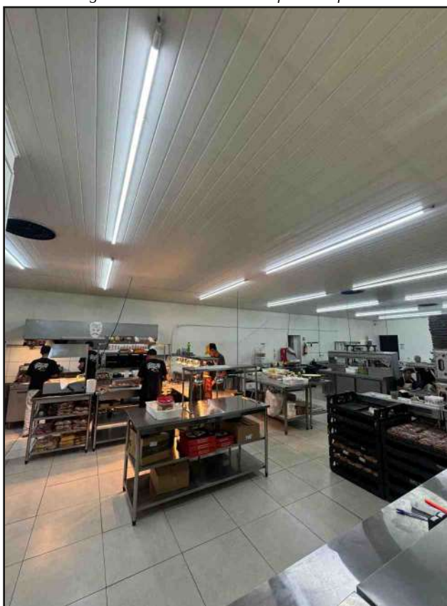
A produção da Diego Souza Burguers é em escala industrial