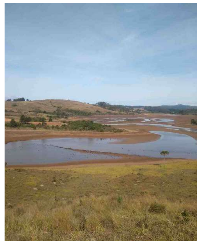
Seca mais severa dos últimos anos: nível dos reservatórios locais estão muito baixos