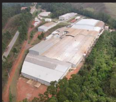
Fábrica Lorenzetti em Poços de Caldas

A Lorenzetti tem orgulho em fazer parte desta história, com inovação, tecnologia e desenvolvimento.