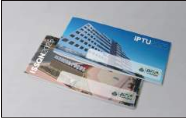
Pagamento do IPTU á vista dá 2% de desconto

A primeira parcela do Imposto Predial e Territorial Urbano (IPTU) vence a partir de 10 de abril, seguindo até 16 do mesmo mês de acordo com o número do carnê. Ao todo são 98 mil carnês, que começaram a ser distribuídos pelos Correios em 17 de fevereiro e seguirão sendo entregues até meados do mês de março próximo.