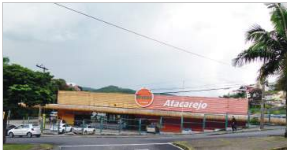
Sob nova direção, espera-se que a loja do Beretas Zona Leste seja revitalizada e melhorada

Depois de quase um ano de obras, instalações e planejamento, o Supermercado Arco Íris, no Alto Dom Bosco, chegou à fase final da ampliação que praticamente vai dobrar sua área de vendas, serviços e administração. Tudo em alto nível e com a adoção de novas e inovadoras tecnologias que vai torná-lo o supermercado mais moderno da zona leste, em níveis de qualidade comparados ao Via Sul e VilleFort. Segundo seus diretores, a ampliação trará muito mais conforto e comodidade aos clientes e também terá novos produtos e serviços.